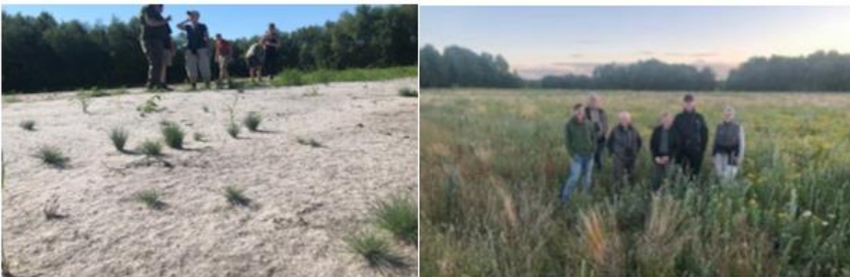
Til venstre: juni 2021, til højre: juli 2020

Botanikliste ved besigtigelse: Ager-stedmoder, vikke sp., ager-vikke, forglemmigej sp., valmue sp., gul kløver, lancet vejbred, rød syre, agerkål, almindelig hønsetarm, gul rejnfan, pilurt sp. (lille), almindelig brunelle, kamille sp., kornblomst sp., ranunkel sp., ærenpris sp., hyrdetaske, hejrenæb, almindelig hanekro og sandskæg.