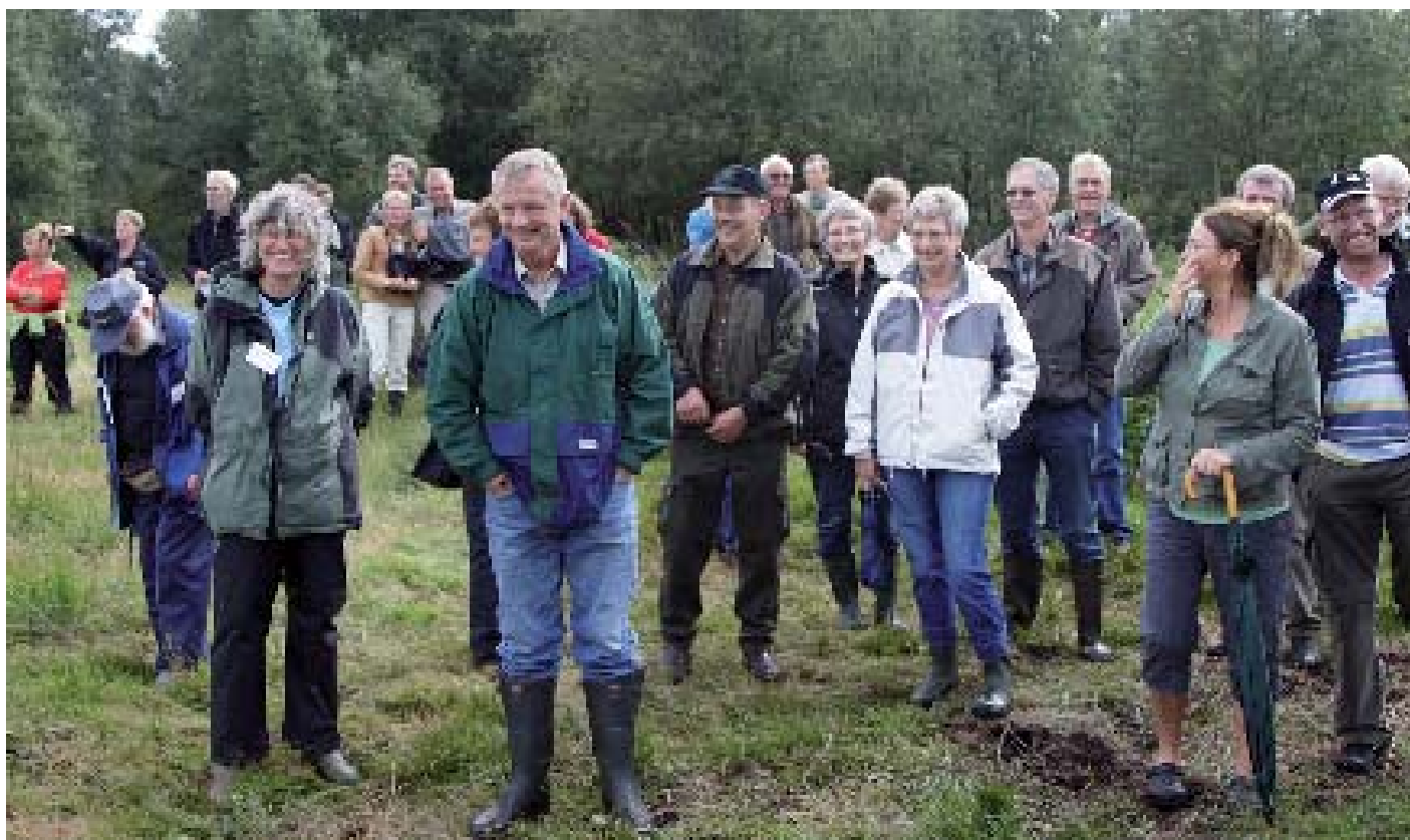
I forbindelse med indvielsen af de nye publikumsfaciliteter blev der afholdt en guidet tur i mosen.