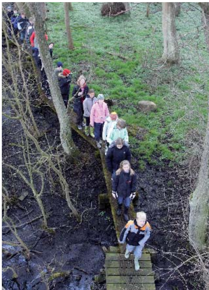
Et stykke af gangbroen ved Gundsømagle Sø - set i fugleperspektiv.