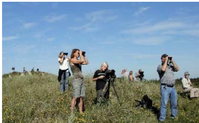
Igen i år var der mange besøgende til Hvepsevågens Dag.

Også i anden sammenhæng har det forløbne år været præget af et positivt samarbejde mellem Fugleværnsfonden, de lokale myndigheder og lokalbefolkningen på Nyord. Gennem knapt to år har en arbejdsgruppe haft travlt med at etablere et stort formidlingscenter på Skov- og Naturstyrelsens gård, Hyldevang, beliggende uden for Nyord By - med udsigt over Fugleværnsfondens engarealer syd for landevejen. Færdiggørelsen af "Fase 1" af denne plan blev fejret en solskinsdag i slutningen af september, hvor en række publikumsfaciliteter blev indviet. Fra en udsigtsplatform kan man nu nyde fuglene på Fugleværnsfondens arealer på sydengen, ligesom der er etableret tre shelters, et bålhus, en naturlegeplads og en meget flot udstilling om fugle, natur og kultur på Nyord. Vi tror, at de nye tilbud til publikum vil blive benyttet flittigt.