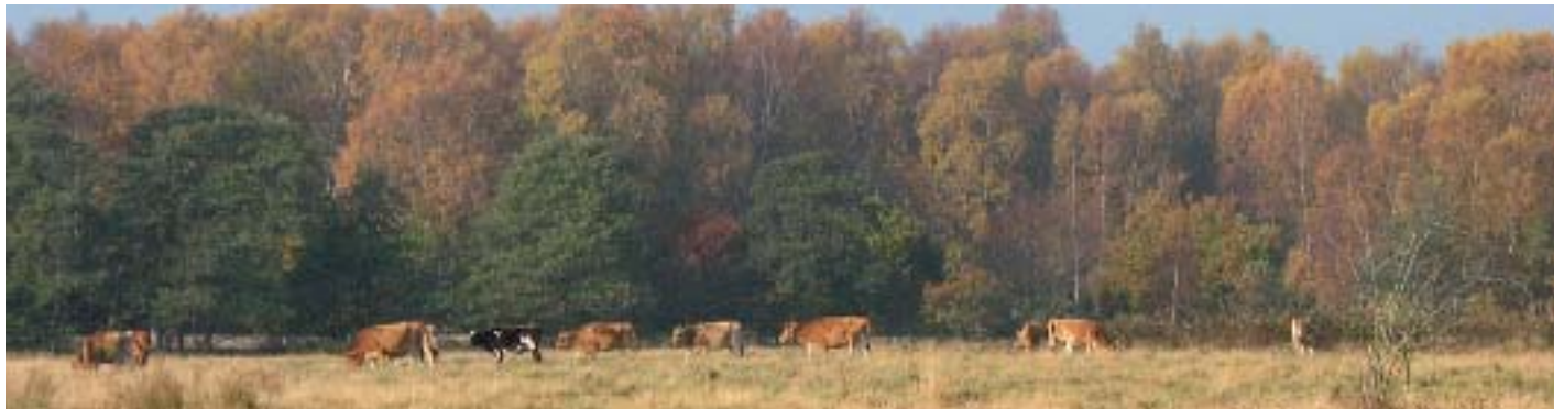
Engen ved Stubbe Sø en smuk efterårsdag.