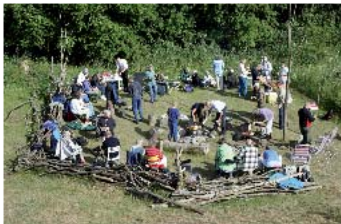
Årets tur for Fugleværnsfondens støtter gik til Ravnstrup Sø. Ved ankomsten blev der serveret lidt bålmad.

Ved Vesttårnet er der blevet fjernet et pilekrat, så det bliver lettere at slå det lille engstykke, som arbejdsgruppen hver år slår med le.