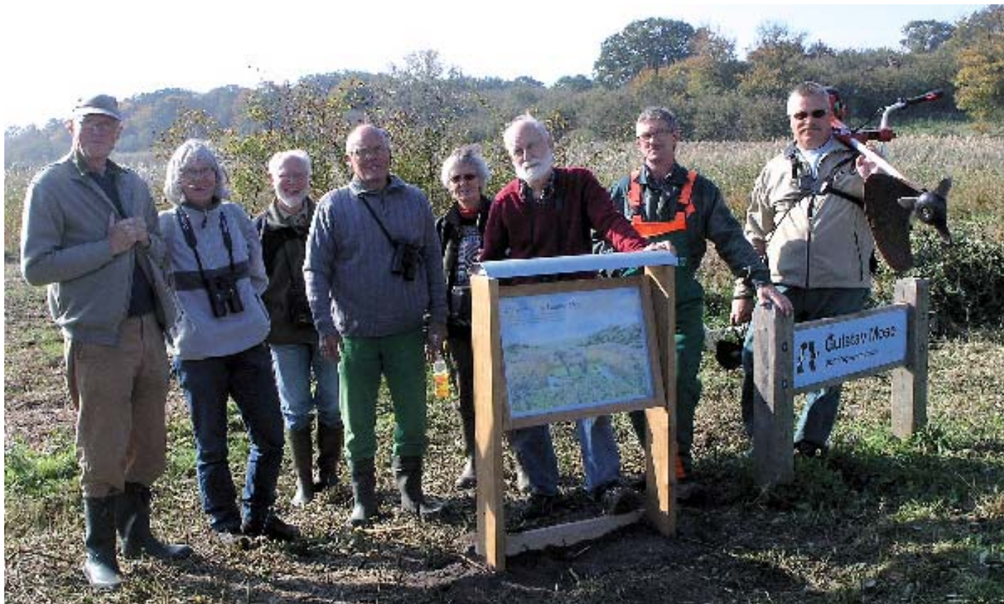
Arbejdsgruppen har netop sat det nye planchebord op ved Gulstav Mose.