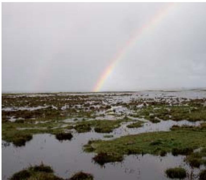
Engene ved Agerø kan undertiden være ret så fugtige.

Et større naturgenopretningsprojekt er blevet gennemført denne sommer ved Stubbe Sø på Djursland. Projektets formål er at genskabe en mere åben natur i form af et tørt overdrevsareal, der kan tiltrække arter som rødrygget tornskade, hedelærke og skovpiber, samt planter som hedelyng og gul evighedsblomst. Skråningerne rundt om Stubbe Sø er hovedsagelig skovbevoksede, med kun få lysåbne arealer, og Fugleværnsfonden tror og håber, at projektet vil give ovennævnte arter et tiltrængt fristed. Den lokale arbejdsgruppe fjerner løbende opvækst af birk og bjergfyr, og er dermed med til at bevare og forbedre det åbne overdrev. Arbejdsgruppen har også oprettet et hyttelaug, der tager sig af vedligeholdelse og udlejning af Bogpeters Hytte - et sommerhus, der giver DOFs medlemmer mulighed for at opleve en smuk udsigt over et smukt landskab ved Stubbe Sø. Man kan læse mere om Bogpeters Hytte og om lejebetingelserne på Fugleværnsfondens hjemmeside.