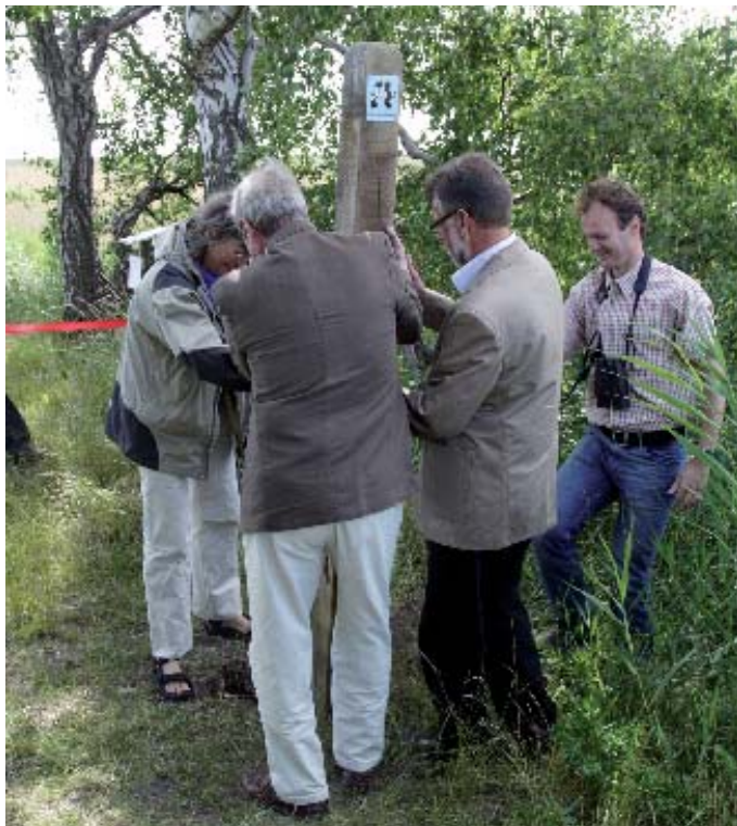
Fugleværnsfondens piktogramstolpe bliver ved fælles hjælp fra både borgmester, Den Hageske Stiftelse og medarbejdere i Fugleværnsfonden, rammet i jorden.

Områdets ejer, Den Hageske Stiftelse, og Fugleværnsfonden har indgået en langsigtet aftale således, at det fremover er Fugleværnsfonden, der står for driften af området. Hensigten med aftalen er gennem fuglevenlig pleje at gøre området endnu mere attraktivt for fuglene og samtidig sikre befolkningen flere og bedre fugleoplevelser ved Øresundskysten. I skrivende stund er vi i gang med at indhente de nødvendige tilladelser til at starte afgræsning, etablere trampestier og planchehalvtag. Det er også meningen, at der skal opføres et lille, åbent fugletårn med kig ud over vandet og strandengene. I starten af november blev oprettet en ny lokal frivillig arbejdsgruppe, som ser frem til at give det nye reservat en hjælpende hånd. Man kan læse mere om Nivå Bugt i Fugle og Natur 3/2008.