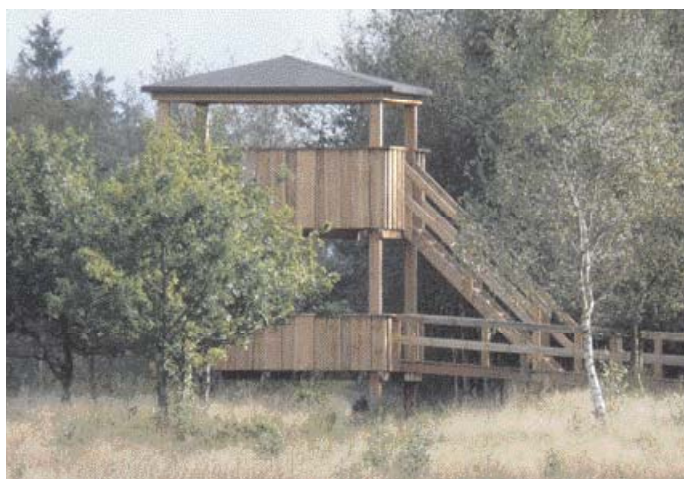
Det nye tårn med rampe til kørestolsbrugere ved Søgård Mose.