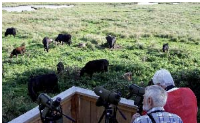
Holger og Claus fra arbejdsgruppen ved Nyord Enge nyder udsigten fra den nye udsigtsplatform.

rørskovens fugle stortrives. Det nærmest vrimler med vandrikser, rørdrummen er blevet fast ynglefugl i reservatet, og i 2008 yngede mindst to par rørhøge i området. Også rørspurven og rørsangeren yngler talrigt, sammen med færre sivsangere og skægmejsler. Desuden har man i længere perioder kunne glæde sig over savisangerens specielle sang.