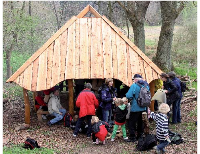
Det nye bålhus ved Vaserne bliver indviet på en tur kun for bedsteforældre og børnebørn.