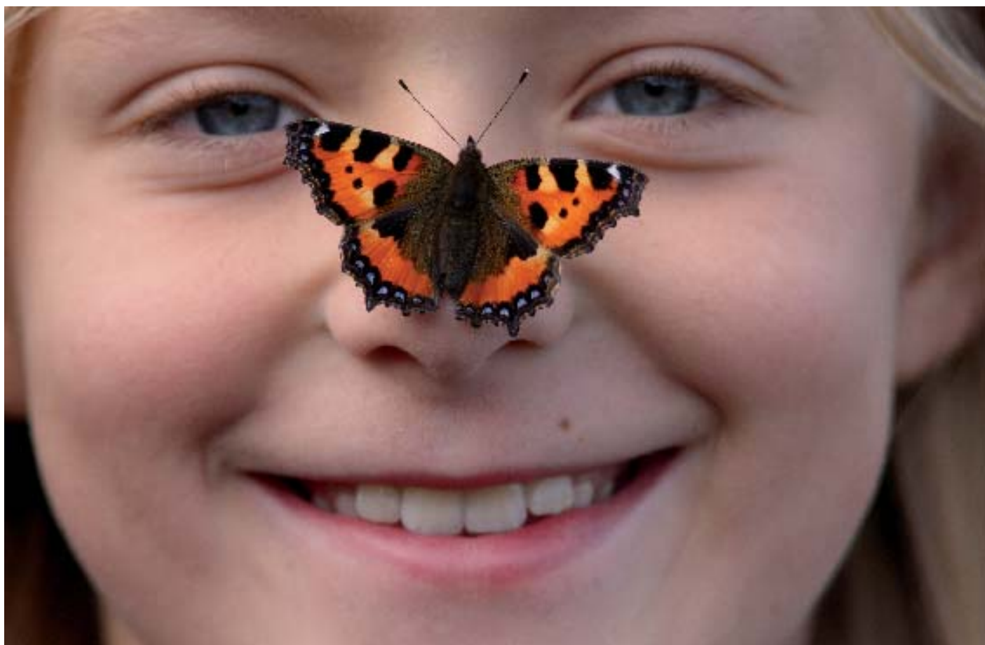
Fugletur ved Gundsømagle Sø.