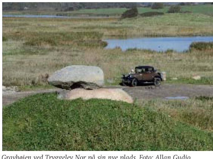
Gravhøjen ved Tryggelev Nor på sin nye plads.