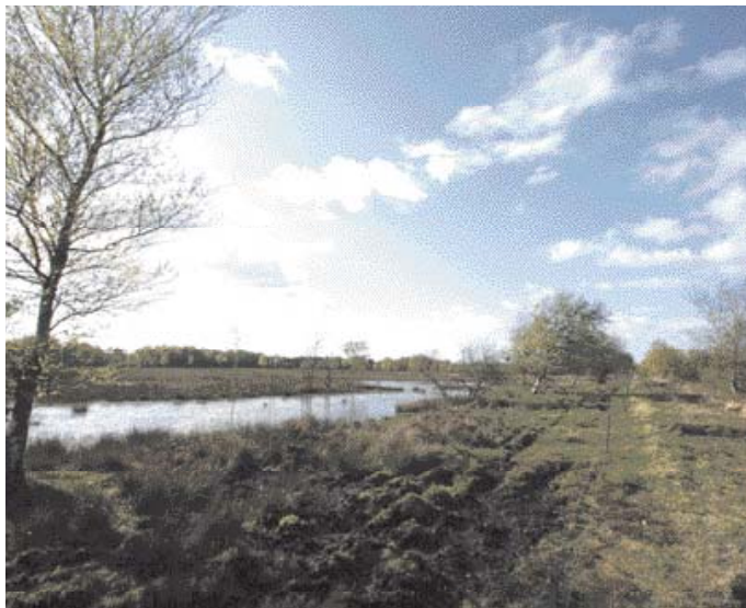
Sølsted Mose en forårsdag.

Arbejdsgruppen ved Stubbe Sø har i det forløbne år brugt megen tid og mange kræfter på at opføre et nyt brændeskur. Brændeskuret er stort og flot, og det er nu fyldt med masser af tørt brænde til brug for de lejere af huset, der holder af at hygge sig i varmen fra brændeovnen. Huset ved Stubbe Sø,