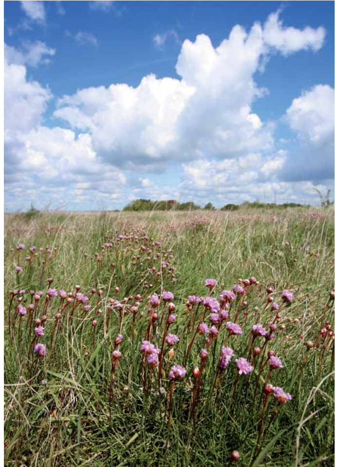
Engelsk græs ved Bøjden Nor.