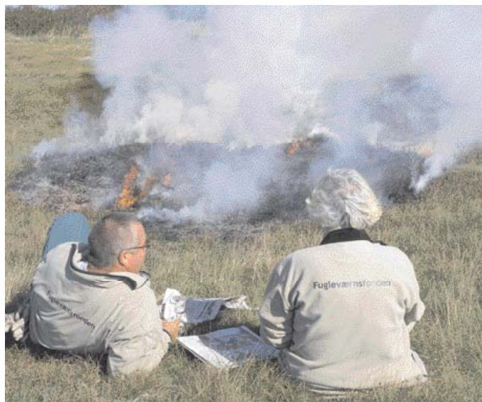
Lyngpleje ved Tryggelev Nor.