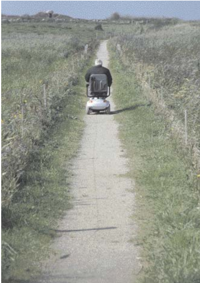
Nu kan kørestolsbrugere også besøge skjulet ved Tryggelev Nor.