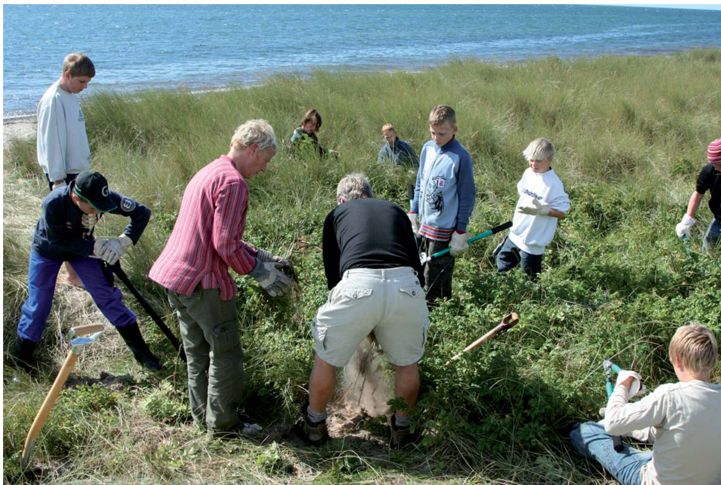
Alle i fuld sving.