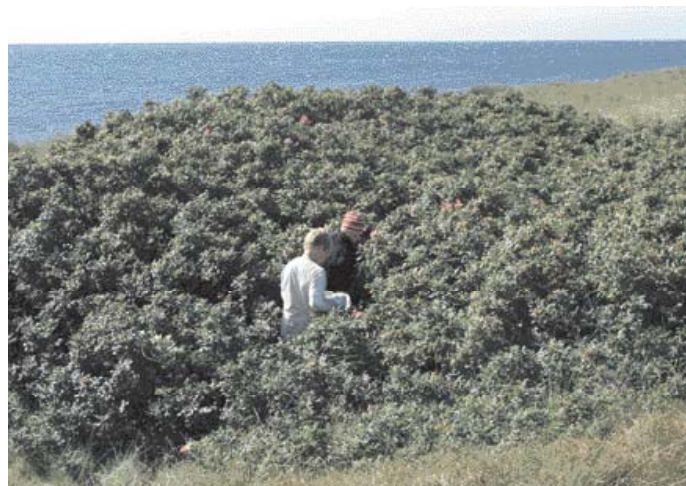
Sådan så rosenkrattet ud før besøget...

plante Rynket rose (Rosa rugosa). Planten har i de senere år spredt sig over store arealer på Hyllekrog, og der var ikke rigtig nogen som for alvor havde mod på at stoppe dens fremmarch. Forståeligt nok - for den tornede plante med de velmagende hyben, er bestemt ikke rar at komme i nærkontakt med.