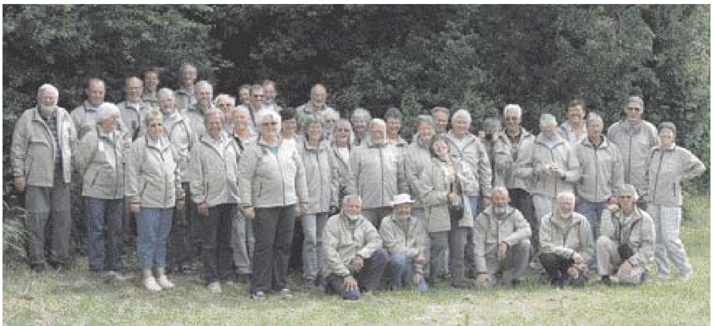
Fællestræf 2007 – hele banden samlet!

I det forløbne år har man jævnligt kunnet se hvide storke spankulere rundt mellem kreaturerne på Fugleværnsfondens eng. Fuglene stammer fra forskellige storkeprojekter og kan derfor ikke betegnes som ”vilde”, men fuglene finder selv deres føde og giver de besøgende i