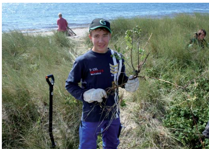
Jan den rod! Det er vigtigt at få hele roden med.

Se flere billeder fra dagene på Hyllekrog og læs om Adopter et Reservat på Fugleværnsfondens hjemmeside: www.fugleværnsfonden.dk