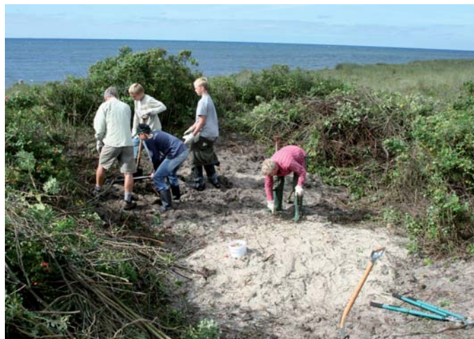
...og sådan så det ud et par timer efter!