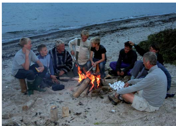
Trætte arbejdsmænd ved bålet.