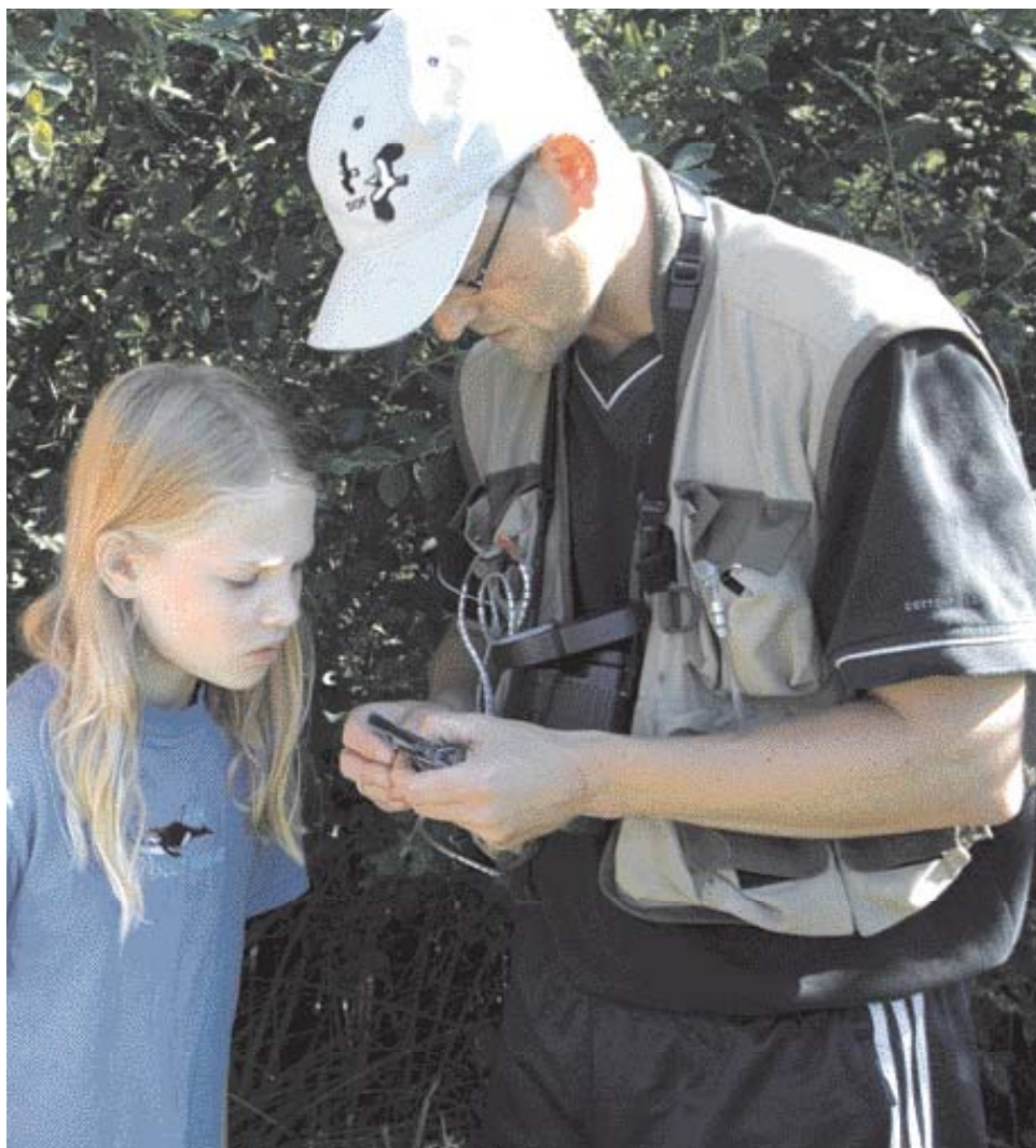
En af de lokale ringmærkere giver en musvit en ring om benet.

Ud over småfuglene er Ravnstrup Sø en god gæselokalitet i januar og februar måned, ligesom fiskeørnen er en regelmæssig gæst i september måned. Rørhøgen yngler i reservatet og i de seneste år er også sjaggeren blevet registreret som ynglefugl.