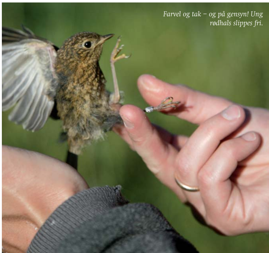
Farvel og tak – og på gensyn! Ung rød Hals slippes fri.