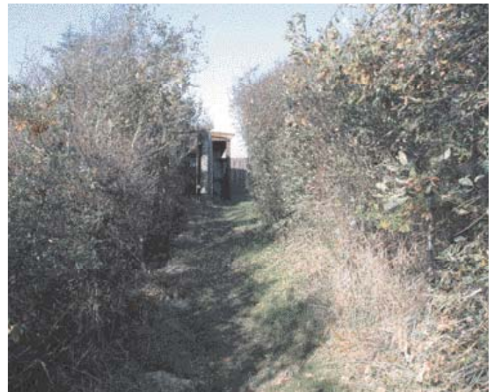
Stien til skjulet ved Agerø.

Agerø er kendt for de mange lysbugede knortegæs, der raster her i efterårs- og forårs månederne, men mange andre fugle nyder godt af freden og de gode fødemuligheder på Agerø. Grågæs og pibeænder ses i hundredvis, og blandt de tusindvis af hejler, der hviler på strandengen om dagen, man kan være heldig at få øje på en storspove eller en stor kobbersneppe.