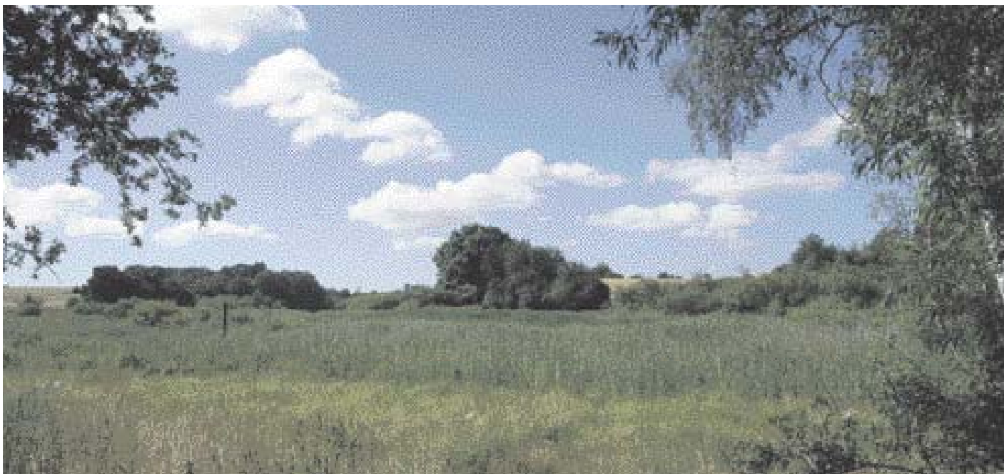
Ravnstrup Sø en varm sommerdag.

I 2007 blev naturstien ved Ravnstrup Sø forlænget, så den nu er ca. 2 km lang, tur/retur. Undervejs er der spændende oplevelser for hele familien. Et par steder ændrer trampestien karakter og føres som en gangbro igennem Ravnstrups mangrove - pilekrattene. Det gælder om at holde sig oppe på gangbroen for under broen er der dybt mudder og giftige planter!