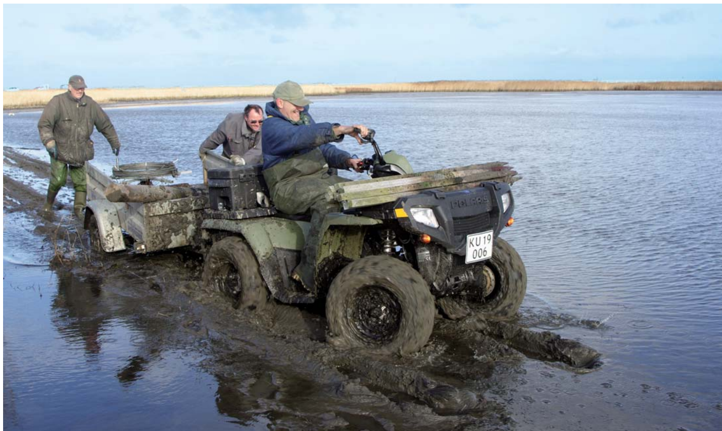
Arbejdsgruppen ved Nyord i gang med at nedtage strandhegnet ved Nyord.

området mange gode oplevelser. Arbejdsgruppen satte for syv år siden en storkerede op på taget af Østrupgård, og i år sås for første gang kortvarigt en stork i reden. Vi er meget spændte på, hvordan det vil gå med storkene næste år, og om de kan klare sig i naturen ved Gundsømagle Sø.