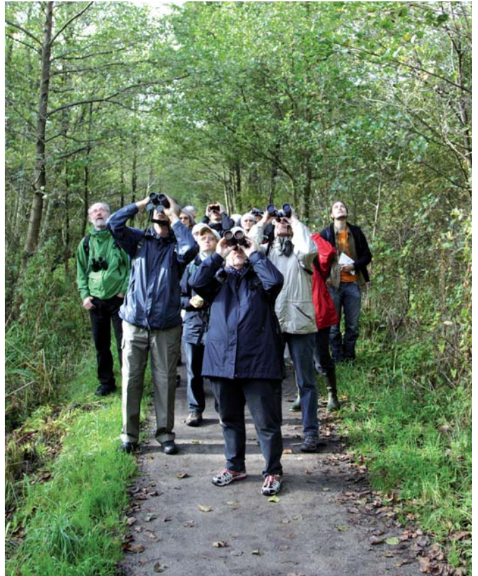
Hør – var det en lille flagspætte? Fugletur i Vaserne.

Den populære trampesti mellem de to fugletårne ved Gundsømagle Sø, der blev bygget som led i Projekt Fugle for Folket i 2005, har visse steder vist sig at være noget mudret i vintermånederne. Derfor er strækningen med gangbro blevet udvidet, så man nu kan komme nogenlunde tørskoet frem. Der er meget at opleve fra denne sti, blandt andet er der rigtig gode muligheder for at se snoge. Disse samler sig om efteråret i store mængder ved stenbunkerne langs stien, ligesom de ofte ses ved den ”snogehøj”, som arbejdsgruppen har bygget ved det vestlige fugletårn.