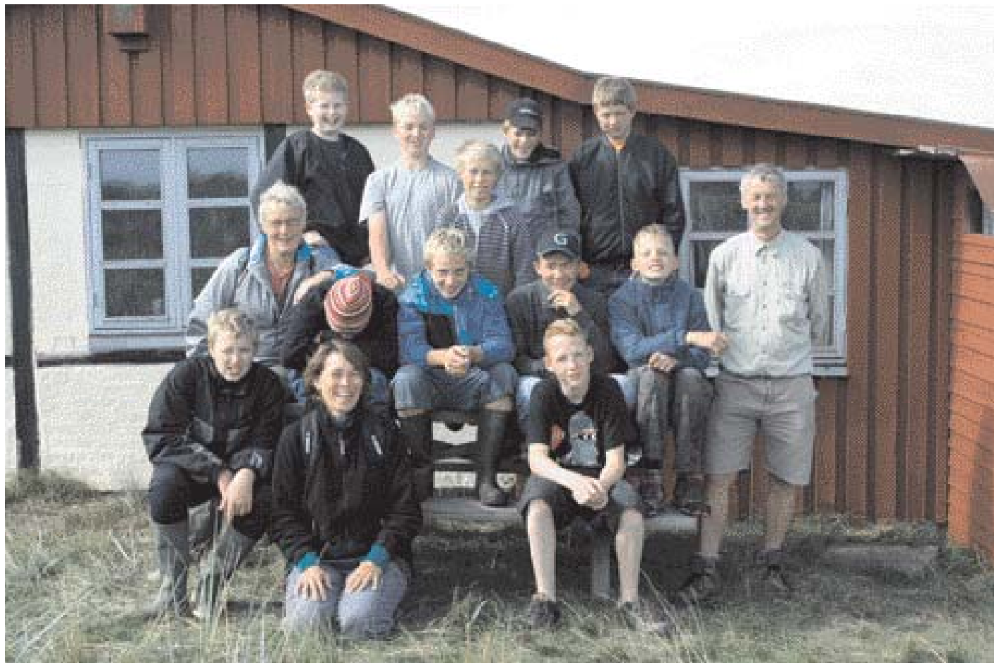
Task Force Bredebro.

”Umuligt. Spild af tid. Stakkels børn. Det kræver da en gravko – eller i det mindste nogle voksne med store muskler. Drop det dog og find på noget andet”. For at sige det mildt, var der en vis skepsis at spore, da Fugleværnsfonden inviterede ”adoptivklassen” fra Sølsted Mose til Hyllekrog for at gå i krig med at udrydde den invasive