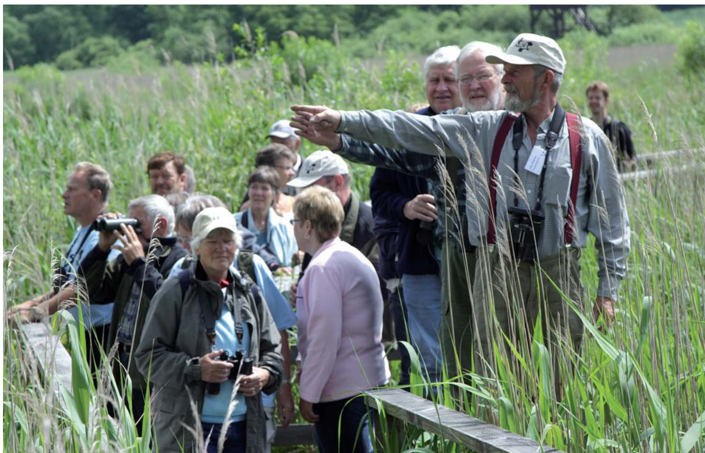
Fugletur ved Gundsømagle Sø.