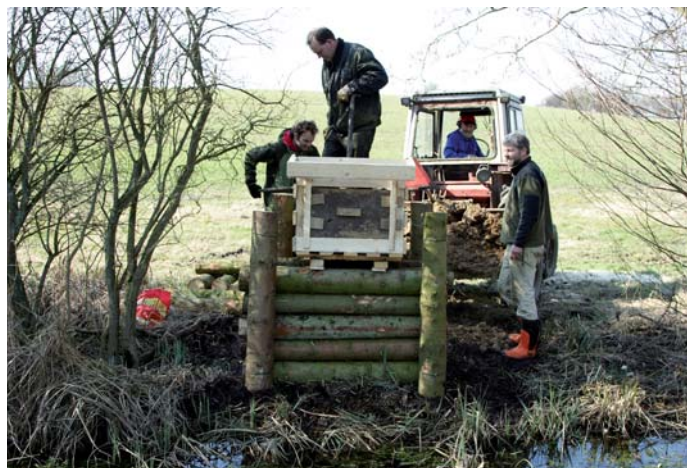
Opsætning af isfuglekasse.

Sø, ferske enge, rørskov, mangroveagtig pileskov, naturskov, 2 km natursti med spændende gangbroer, klatretæer, klappesår, isfugl, rørdrum, fiskeørn - og bliver turen udmattende, er der mulighed for at overnatte i reservatet. Velkommen til Fugleværnsfondens reservat Ravnstrup Sø.