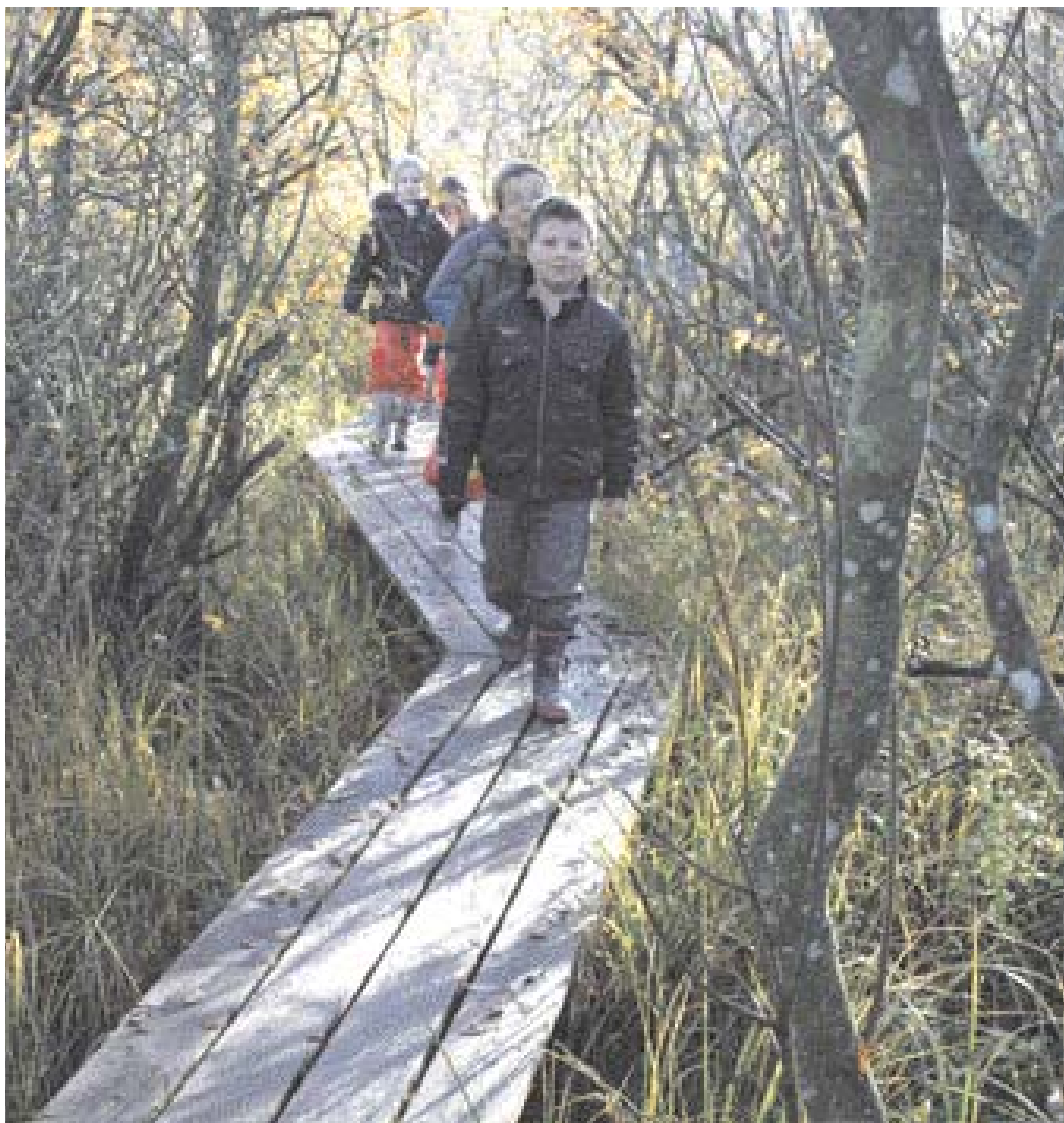
Den lokale adoptivklasse på den nye gangbro i Ravnstrups "mangrove".