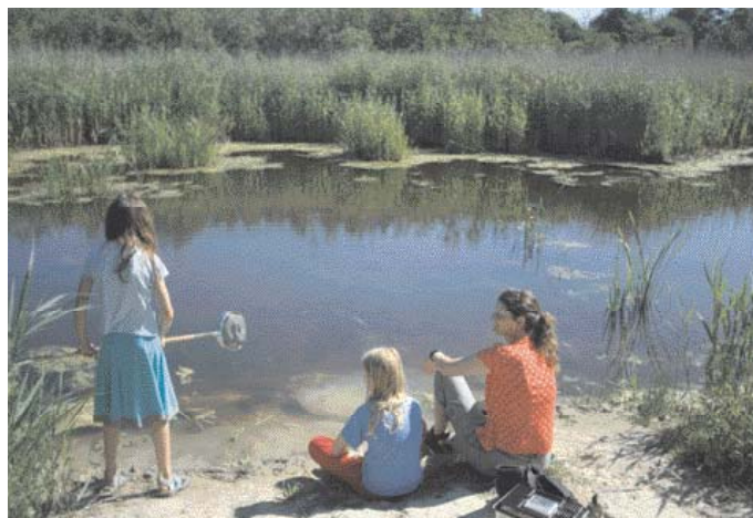
Det nye vandhul til rørdrummen.

Ravnstrup Sø er et afvekslende naturområde. Søen har en vandflade på knap 2 ha og er omkranset af blomsterrige enge, pilesump, rørskov og højstammet naturskov. En fugletur i reservatet byder derfor på mange forskellige fuglearter. Det gælder fiskeørnen, der raster i september, isfuglen i det lille vandhul, eller rørdrummens "pauken" fra rørskoven i marts. Dertil kommer kvækkende frøer, blomstrende anemoner og soldyrkende snoge.