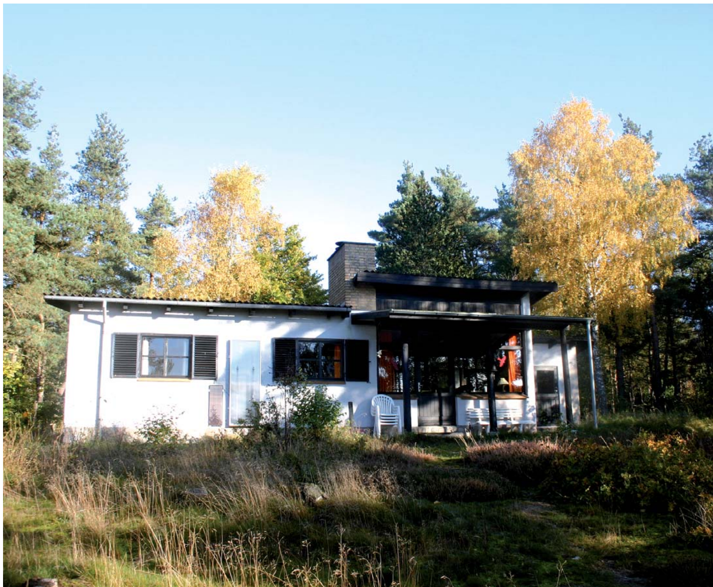
Bogpeters hytte ved Stubbe Sø.

En arv til Fugleværnsfonden er med til at sikre, at også kommende generationer kan opleve glæden ved de vilde fugle og den uberørte natur.