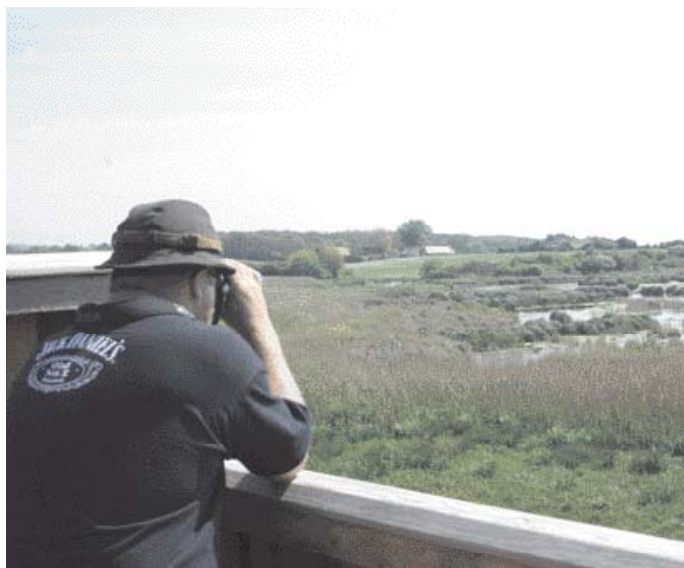
Udsigten fra det nye tårn ved Gulstav.