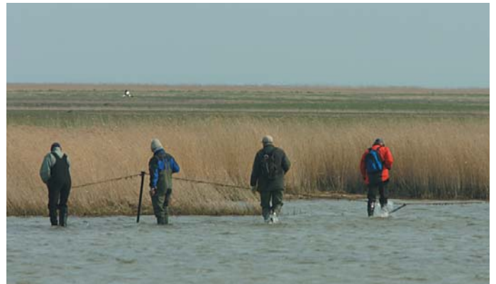
Strandhegnet ved Nyord Enge bliver repareret af arbejdsgruppen.

Syd for Gulstav Mose ligger Dovnsgården, der nu ejes af Skov- og Naturstyrelsen. Styrelsen har indrettet gården som en kombination af naturskole (med mulighed for overnatning), base for interesseorganisationer og center for et stort vildhesteprojekt. Dette projekt har betydet udsætning af et