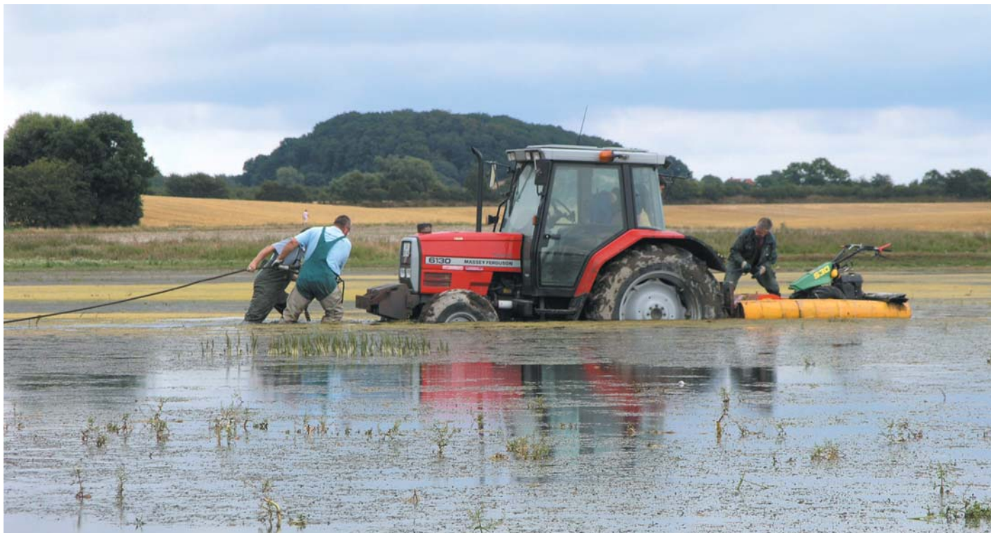
Ornitologer i kamp for klyder! Et forsøg på at få en slåmaskine til øerne i Nørreballe Nor, endte i mudder.