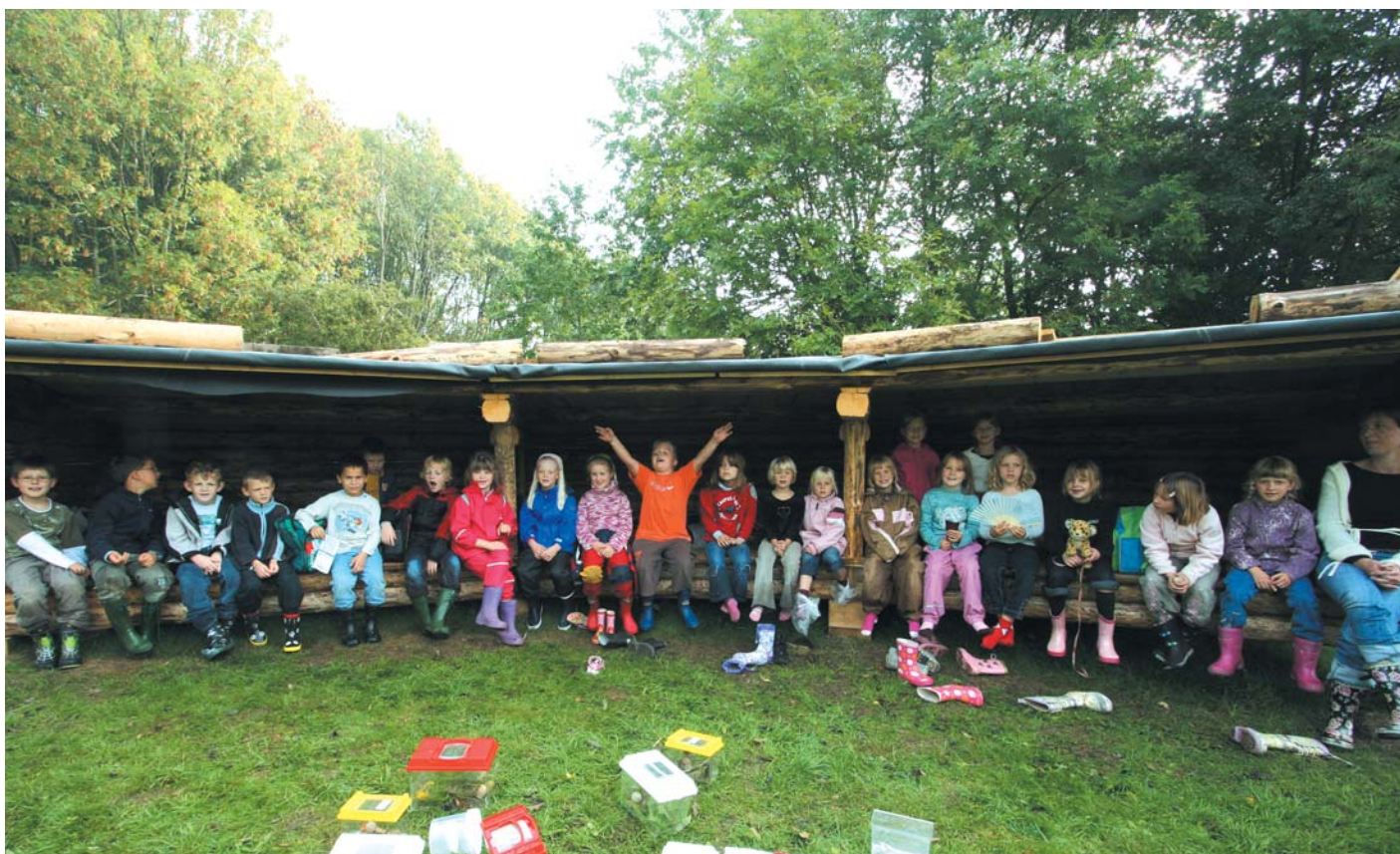
Det nye shelter ved Ravnstrup Sø har fået besøg af 1. klasse fra Glumsø Skole.

Barup Sø ligger som en af flere søer i en 15 km. lang øst-vest gående tunneldal på Nordfalster. Dalen opstod under istiden, og i stenalderen var det en lang, smal fjord. I 1930'erne blev Barup Sø afvandret ved etablering af en kanal, der den dag i dag via en sluseanordning udmunder