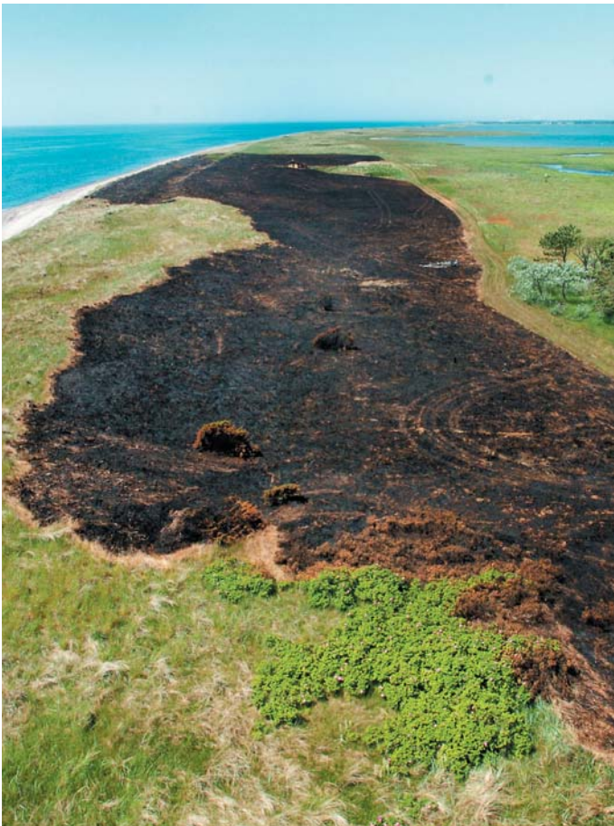
Brandskaderne set fra fyrtårnet.