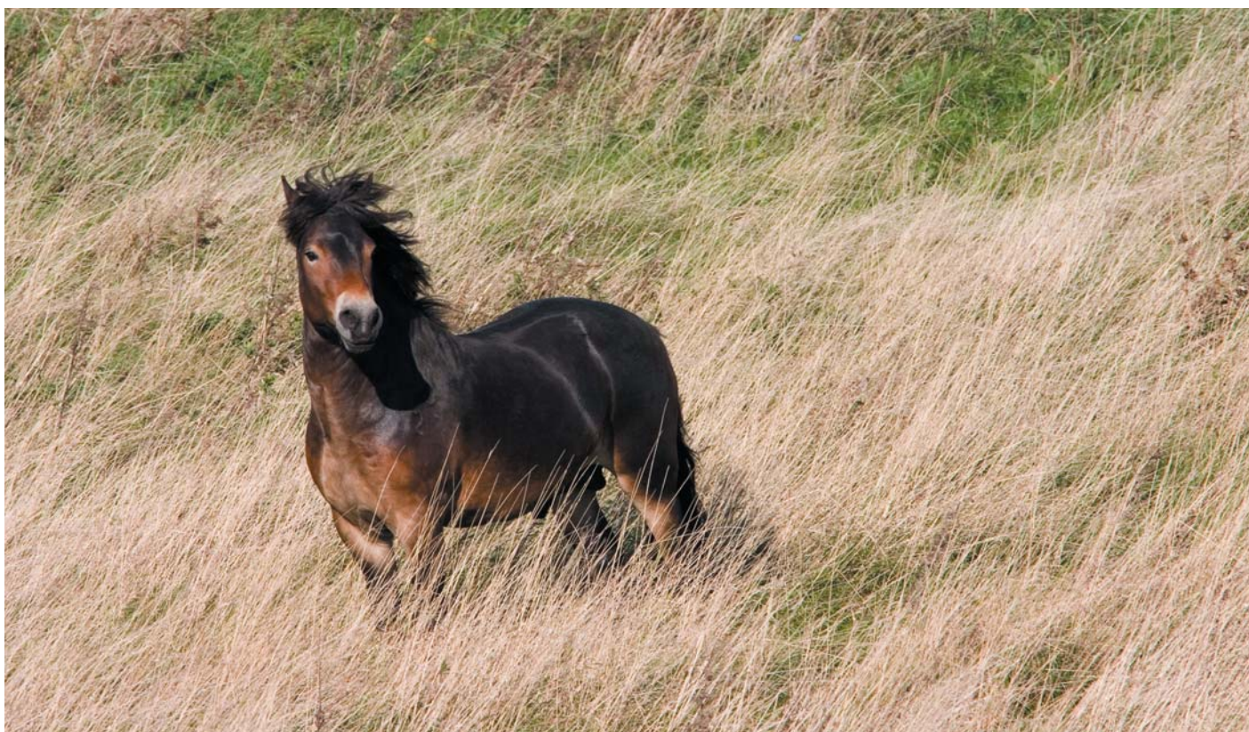
Ved Gulstav Mose græsser nu 26 vilde exmoorponyer. Her den flotte hingst.

Arbejdsgruppen på Lollands sydspids har siden erhvervelsen af fugleværnsområdet i 1995 brugt mange timer og megen energi på at istandsætte den lille hytte, kaldet Ninas Hus, der ligger på Hyllekrogtangen. Hytten fungerer både som samlingssted for arbejdsgruppen og som overnatningssted for de mange venner af Fugleværnsfonden,