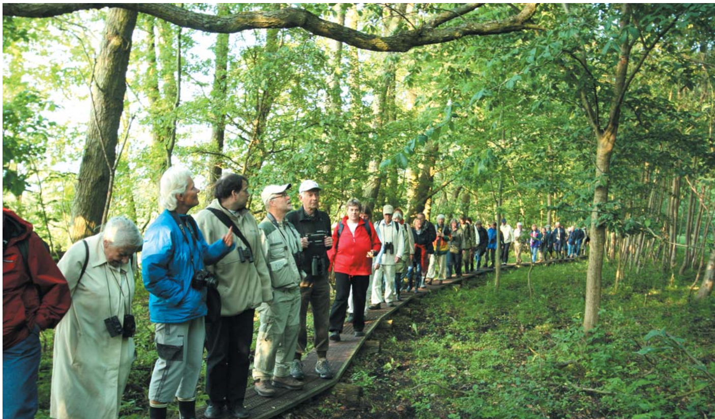
Den årlige tur for bidragsydere var velbesøgt. Turen gik til Gundsømagle Sø.