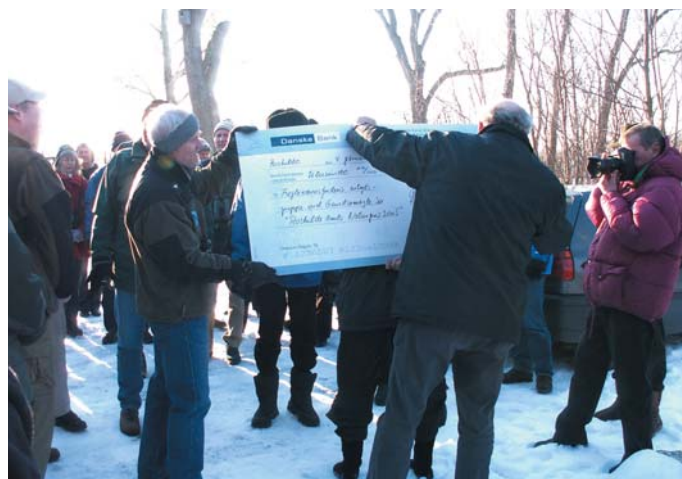
Formanden for Teknik- og miljøudvalget overrækker checken på 10.000 kr. til arbejdsgruppen.

Fugleværnsfondens lokale, frivillige arbejdsgruppe ved Gundsømagle Sø var i februar 2006 den fornemme modtager af Roskilde Amts Miljøpris. Prisen, som i år uddeles for 2. gang, gives til "en person eller en gruppe, som på frivillig basis har gjort en ekstraordinær indsats for at bevare eller forbedre et stykke natur, eller give et bredt publikum nye oplevelsesmuligheder i naturen." Arbejdsgruppen lever med sit store og mangeårige engagement ved Gundsømagle Sø til fulde op til prisen, som blev overrakt af formanden for Teknik- og Miljøudvalget. Med prisen