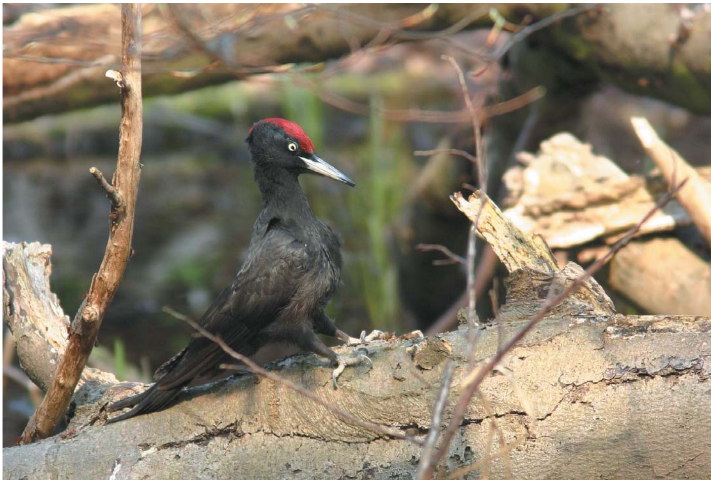
Sortspætten kan ofte opleves nær hytten ved Stubbe Sø.