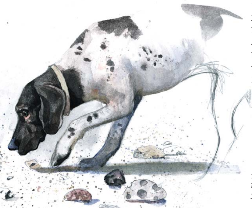
Et nyt hegn ved Bøjden Nor holder løse hunde væk fra ynglefuglene.

Agerø er gæssenes land. Om vinteren og foråret æder store flokke af Lysbugede Knortegæs sig tykke og fede, inden de i slutningen af maj sætter kursen mod yngleområderne på Svalbard og Grønland. Også Grågæssene besøger flittigt fugleværnsområdet. Om efteråret bruger de især Fugleværnsfondens areal som raste- og hvileplads - for de har for længst fundet ud af, at her hersker jagtfreden. Fugleværnsfondens ene nabo driver heller ikke jagt på sine arealer, så når gæssene skal til og fra fugleværnsområdet, benytter de hans marker som jagtsikker flyvekorridor - ofte med jægere liggende på lur på begge sider. Gæs er nemlig kloge fugle!