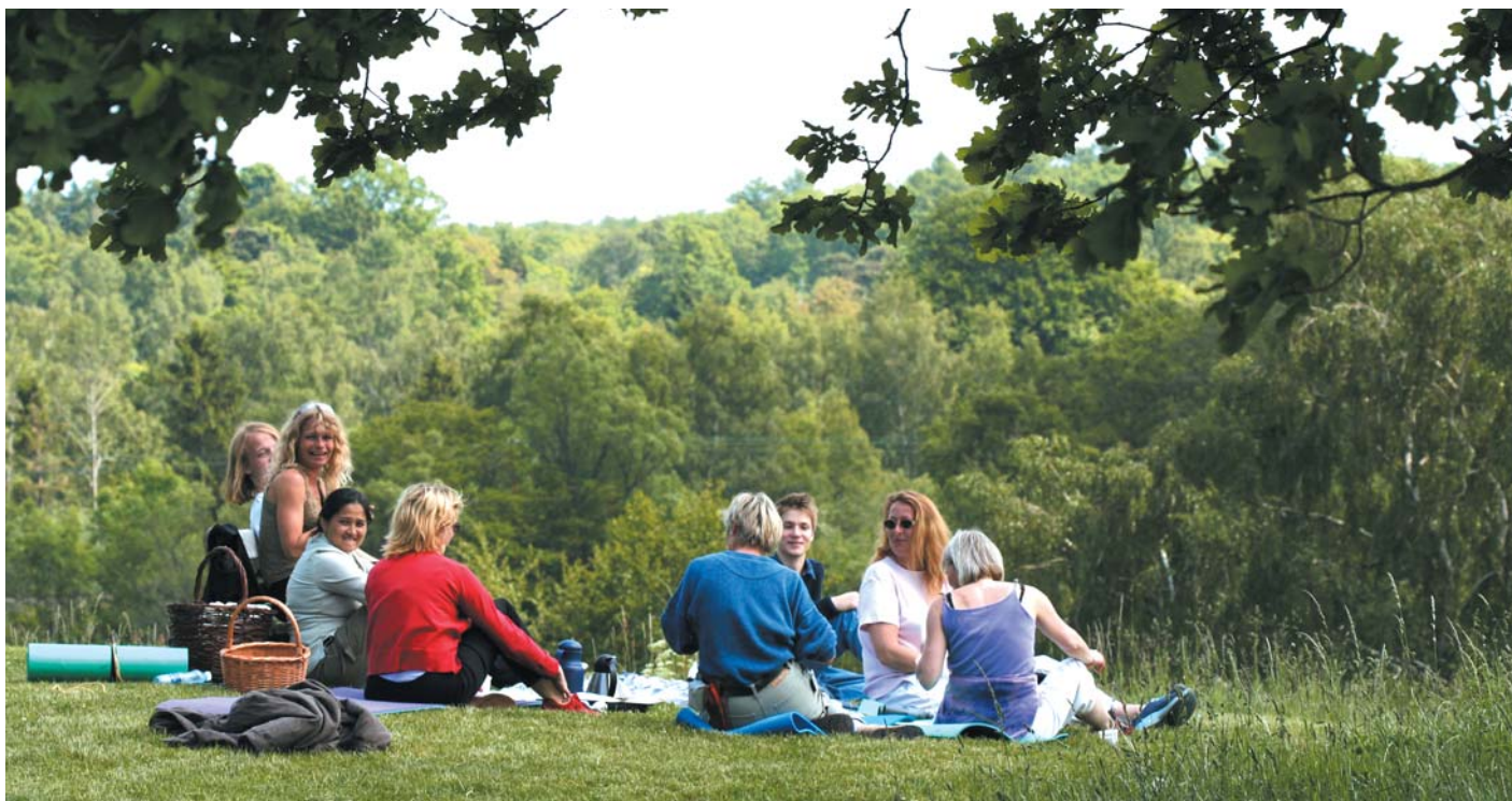
Frokost i det grønne. Vaserne er om foråret et populært udflugtsmål.