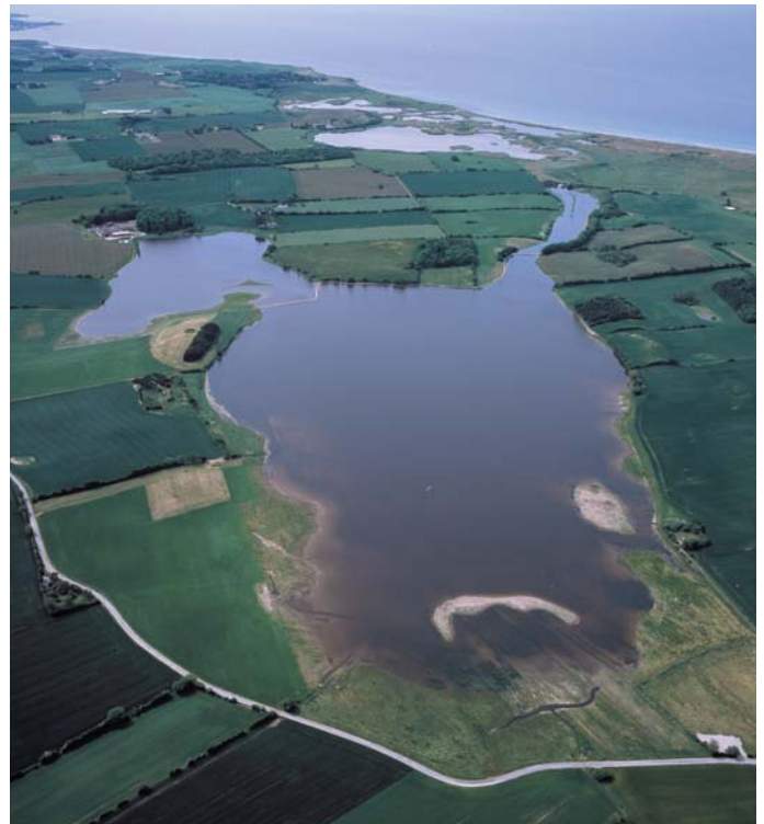
Nørreballe Nor.

Klyderne er pionerfugle, der yngler på områder med meget lidt vegetation. For at øerne fortsat skal være attraktive for dem, er det af afgørende betydning, at vegetationen holdes nede. Derfor har Fugleværnsfondens frivillige arbejdsgruppe kæmpet hårdt for at få slået vegetationen på øerne. Inden næste ynglesæson vil den være slået, så vadefuglene igen kan tage deres øer i besiddelse.