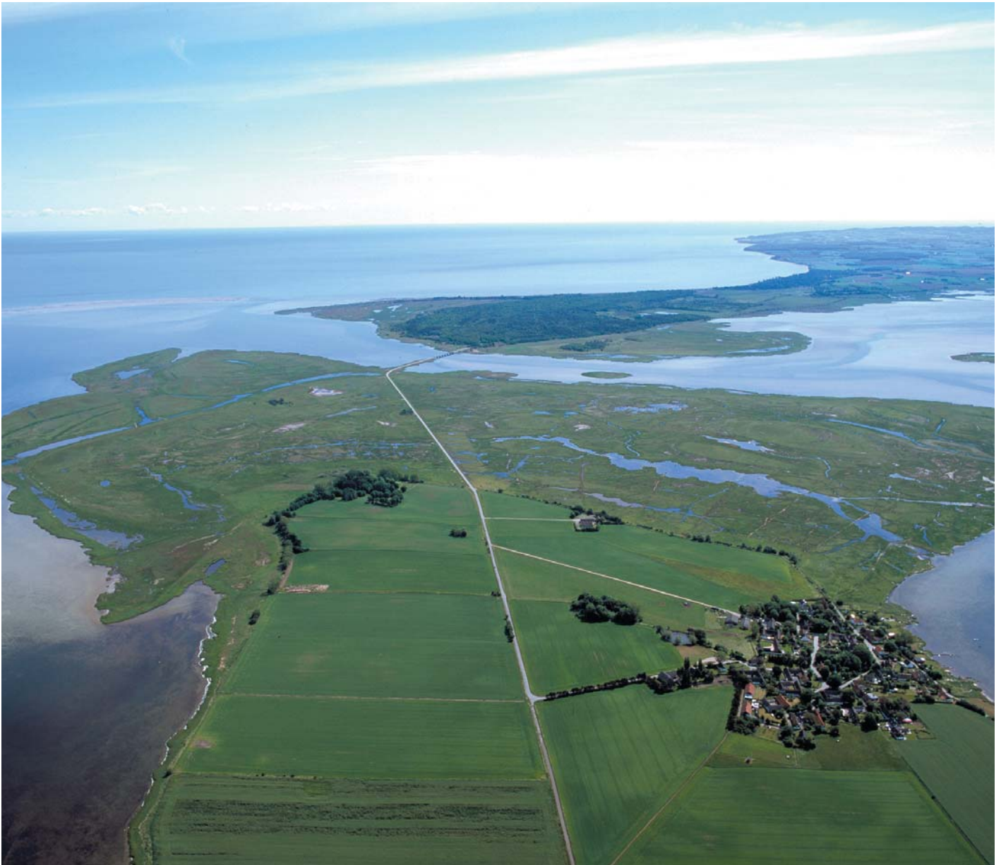
Nyord Enge set fra oven.

En arv til Fugleværnsfonden er med til at sikre, at også kommende generationer kan opleve glæden ved de vilde fugle og den uberørte natur.