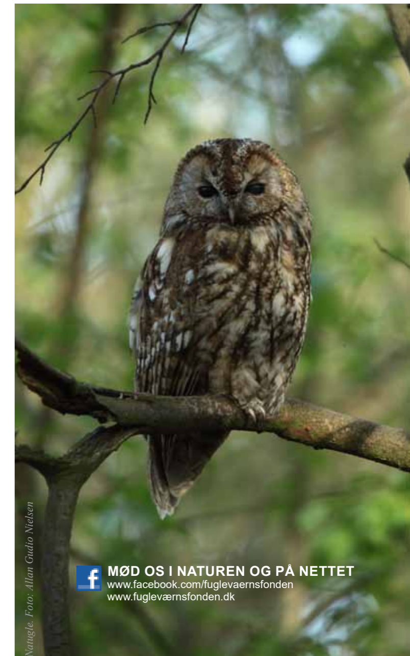
Natugle.