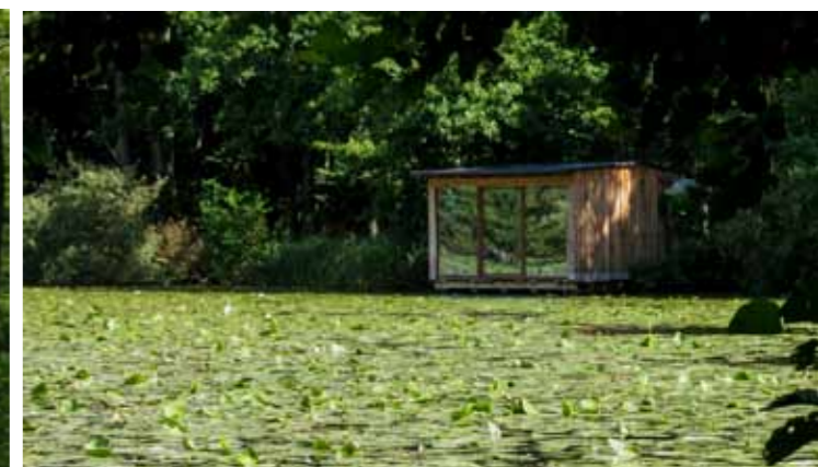
Fugletårn og fugleskjul.