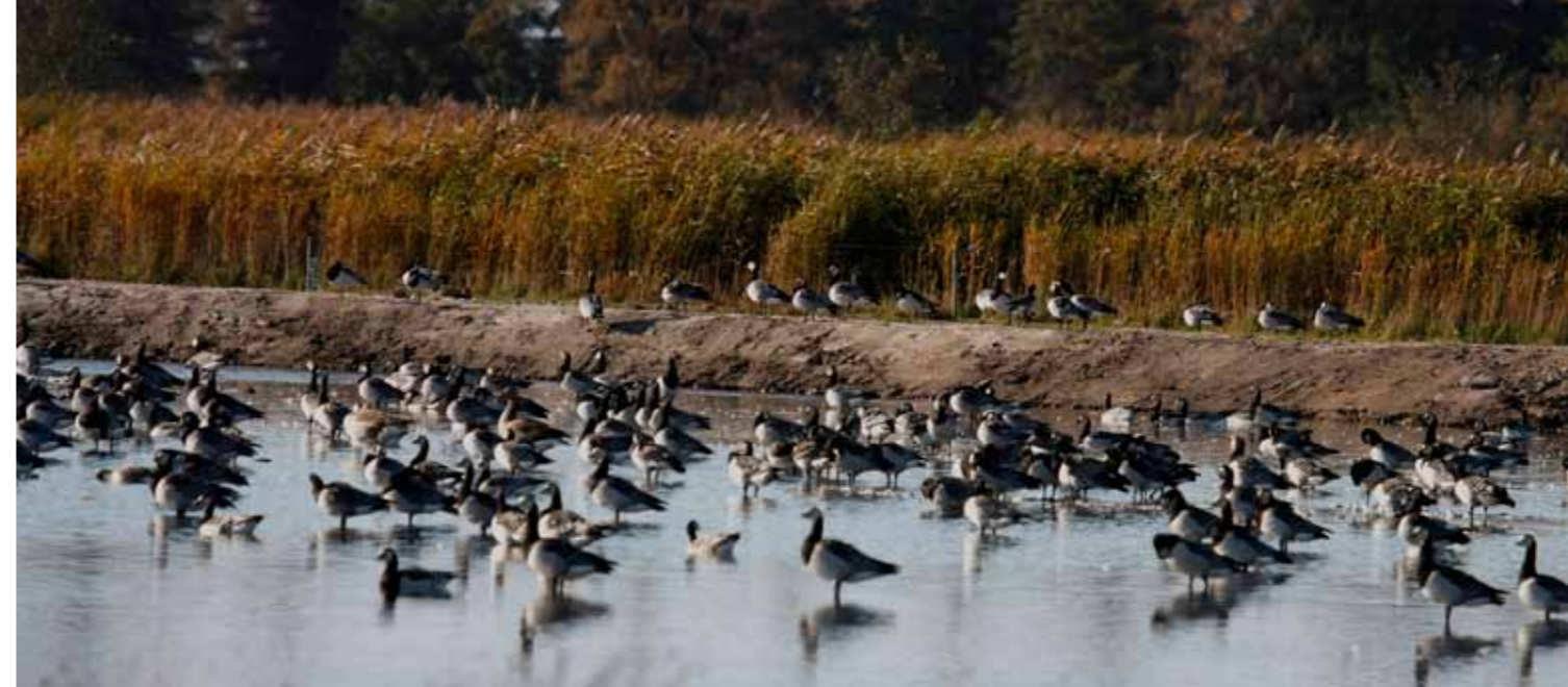
Bramgæs i tusindevis ved de nye ynglerøer i Saksfjed.