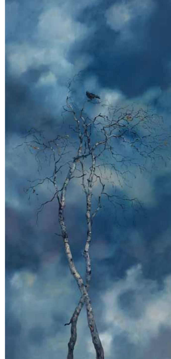
Michael Kvium. Interrupted Skypiece II, 2012. Olie på lærred, 220 x 130 cm. Privateje.

Har du ikke allerede set udstillingen, er omgivelserne i og omkring Vendsyssel Kunstmuseum ligeså generøse over for kunstværkerne, som de har været det på Sophienholm og Johannes Larsen Museet. På Vendsyssel Kunstmuseum er der nemlig tænkt over forbindelsen mellem kunsten og naturen uden for museet, den høje himmel, det vide udsyn med marker, lave forblæste læhegn og det altid nærværende Vesterhav. Så vil du opleve natur, fugle og kunst på en og samme tid, er det oplagt at besøge udstillingen inden den runder af den 26. marts 2017.