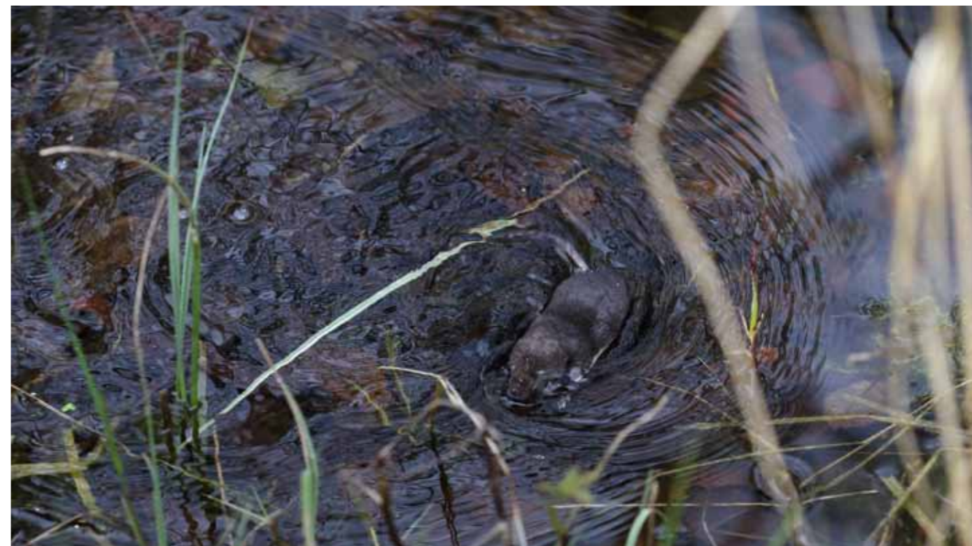
I modsætning til den almindelige spidsmus og dværgspidsmusen, som er gråbrune i pelsen, har vandspidsmusen en smuk skifergrå til fløjlsort overside. Undersiden er ofte helt hvid.