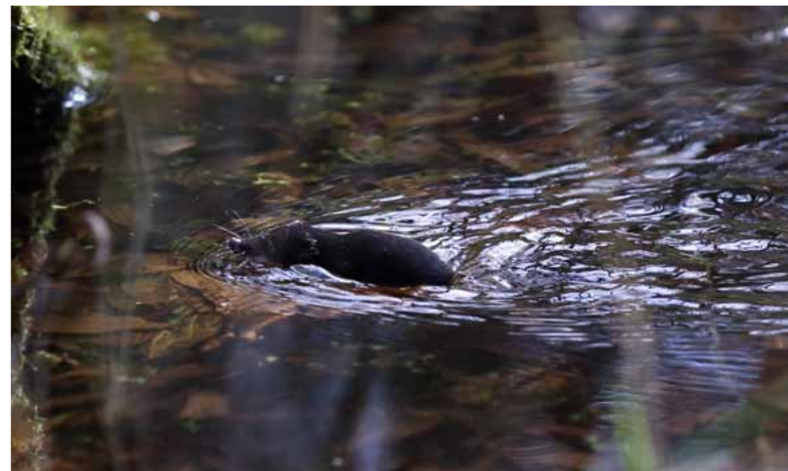
Vandspidsmusen på farten. Det er det lille dyr næsten døgnet rundt. Vandspidsmusen er et aktivt væsen med et højt stofskifte, som byder, at den hver dag må æde en mængde føde, der svarer til sin egen kropsvægt på 20 gram.

På flere af Fugleværnsfondens reservater kan man være heldig at se eller høre vandspidsmus året rundt. I Vaserne er området omkring fugletårnet et godt sted at forsøge sig. Men endnu bedre er gangbroen igennem elle- og pilesumpen ved Ravnstrup Sø. Se mere om disse steder på www.fuglevaernsfonden.dk .