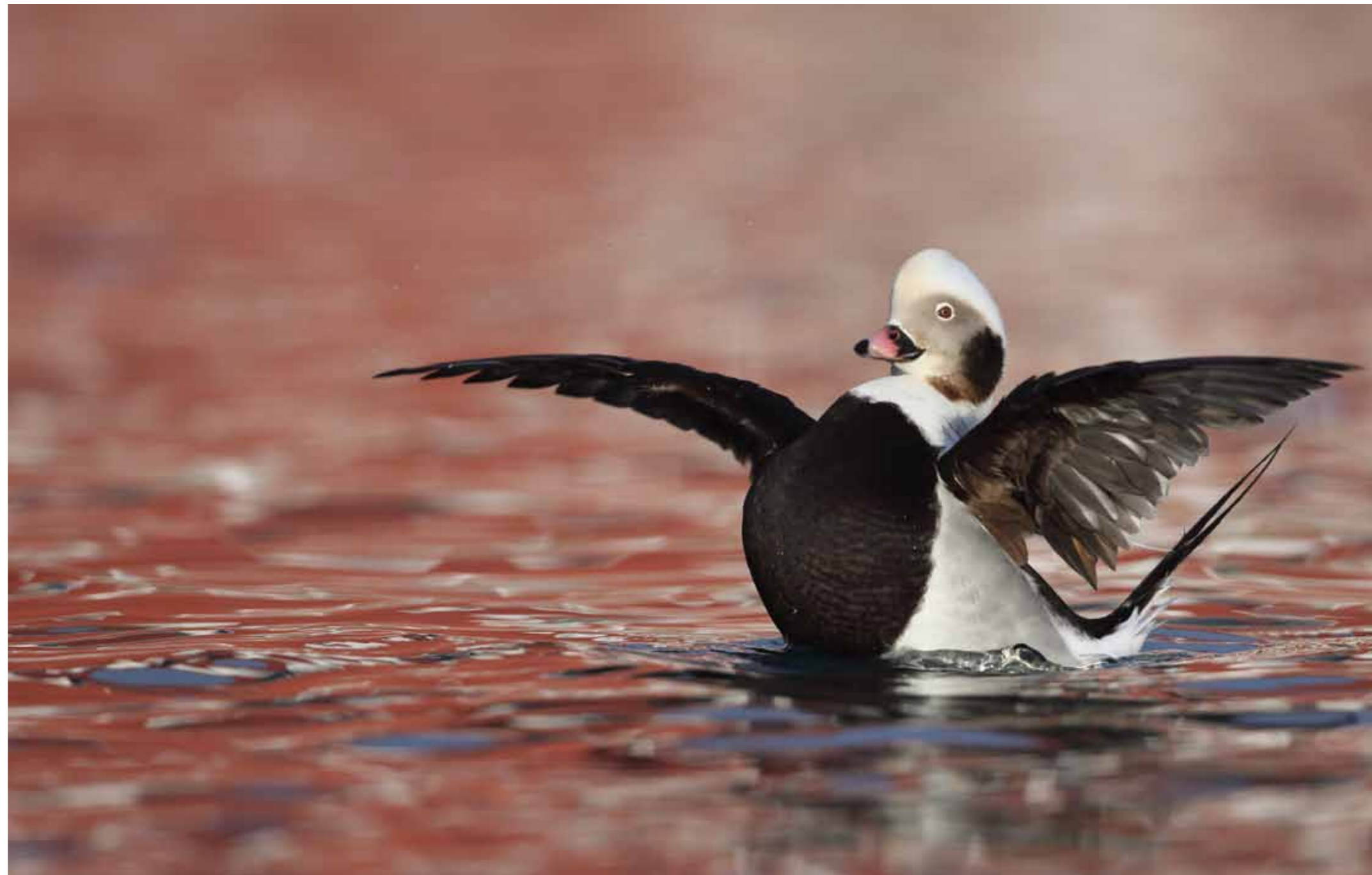
En havlit-tur til foråret kan ihvertfald anbefales – men pas på! Det er kraftigt vanedannede!