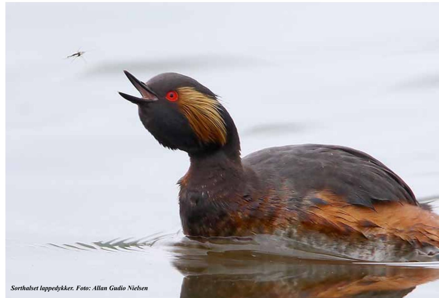
Sorthalset lappedykker.