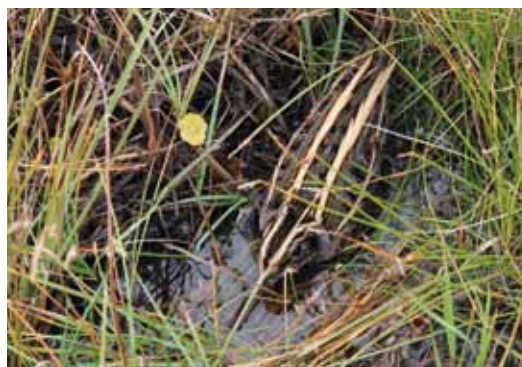
Enkeltebekkasin, der trykker sig.