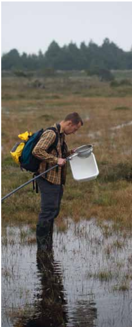
På jagt efter sjældne biller