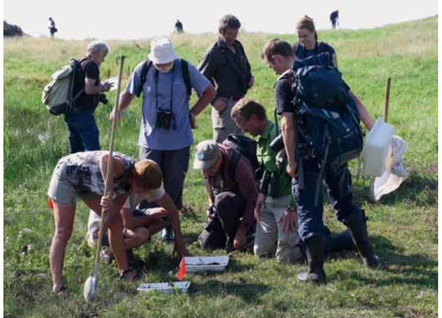
De små vandhuller vrirlede med spændende vandinsekter