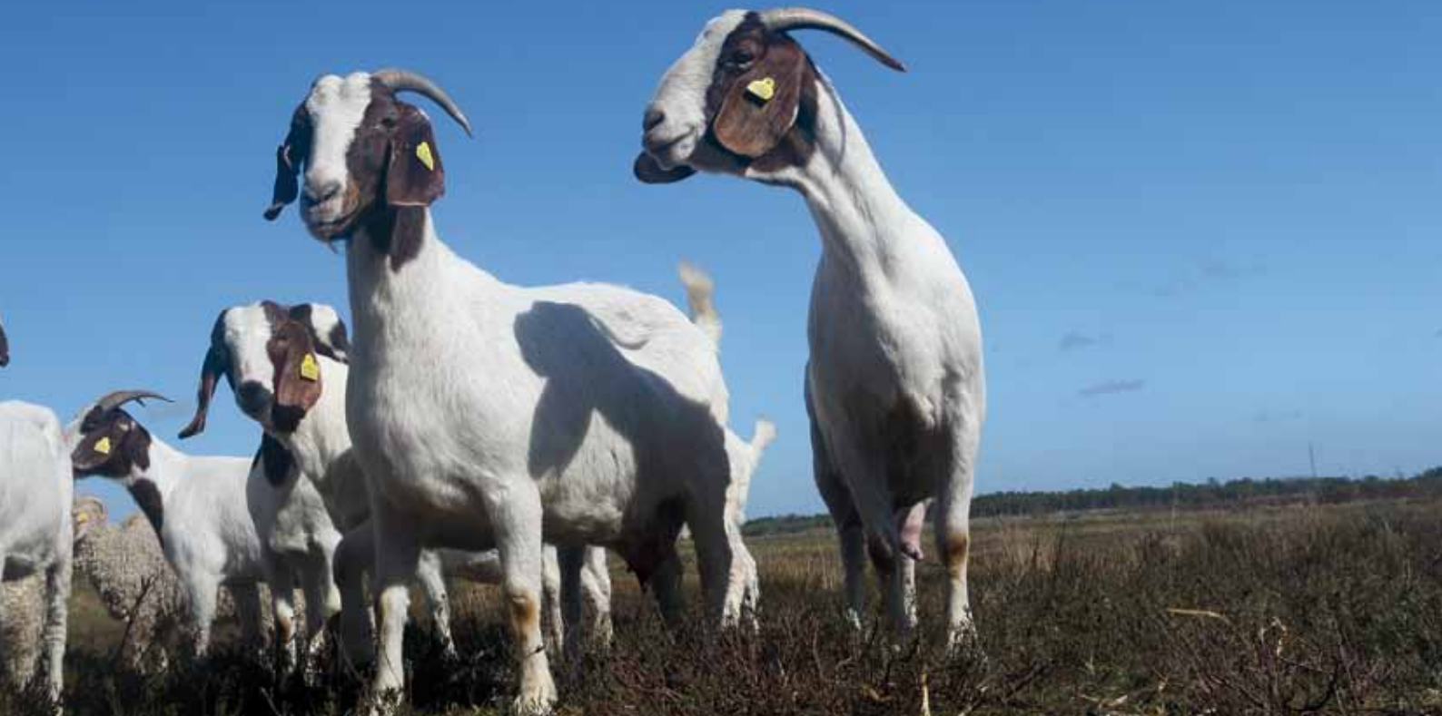
Boergederne, forrest i billedet, er de mest hårdføre og effektive til nedbidningen af vedplanter på de nyrøddede arealer i Sølsted Mose.

dets ynglende tranepar trækker over mosen for at fouragere. Vi går den direkte vej ned til gedefolden, som man kan ane i den fjerne ende af reservatet. Undervejs er det uundgåeligt at bemærke, at området er under stor forvandling. Det igangværende EU LIFE-projekt har ført til store landskabsmæssige ændringer, især de store rydninger og vandstandshævninger har ændret udsynet og oplevelsen. Hvor området før var groet fuldstændig til, skuer man nu ud over et helt åbent landskab – hvor højmosen med tiden skal tage form.