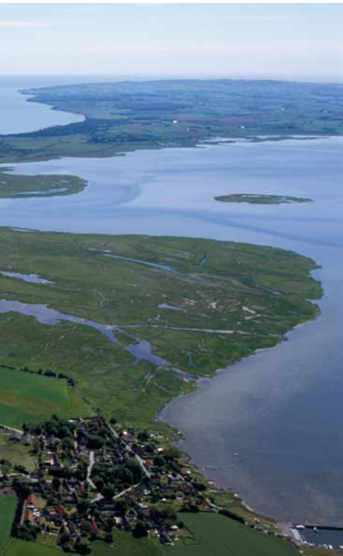
Nyord set fra oven.