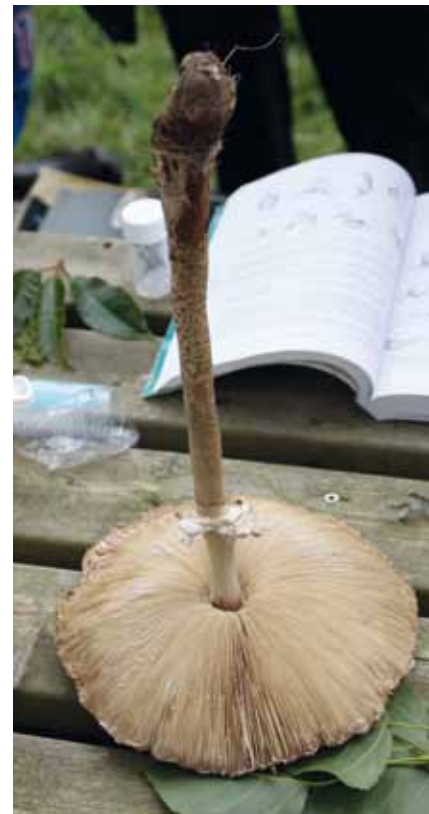
Stor kæmpeparasolhat.