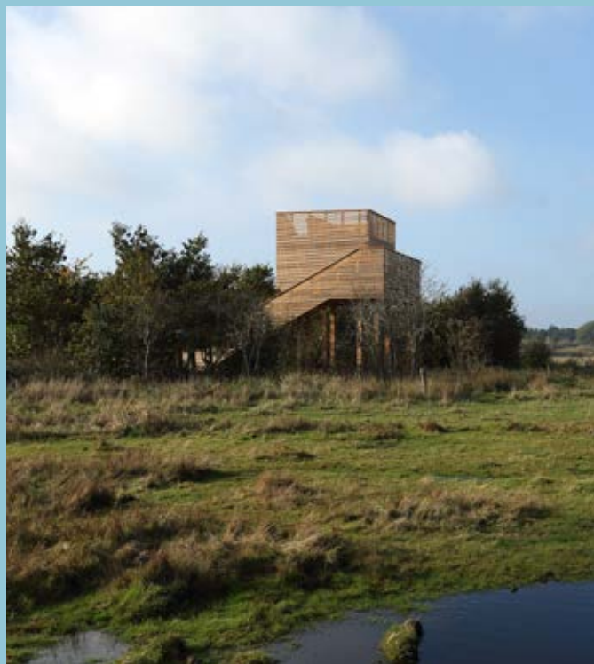
Det er arkitekt Tobias Jacobsen, som har tegnet tårnet.