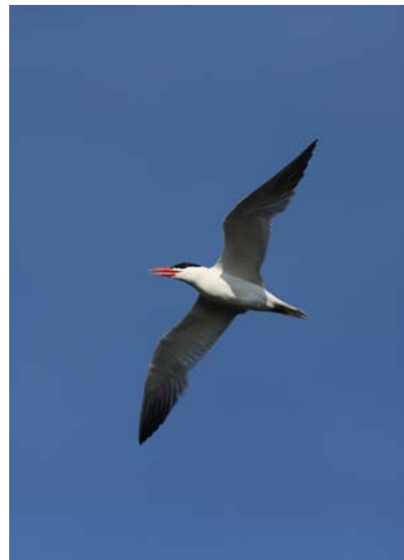
Rovternen gæstede Tryggelev Nor den dag, hvor fællestreæffet fandt sted.