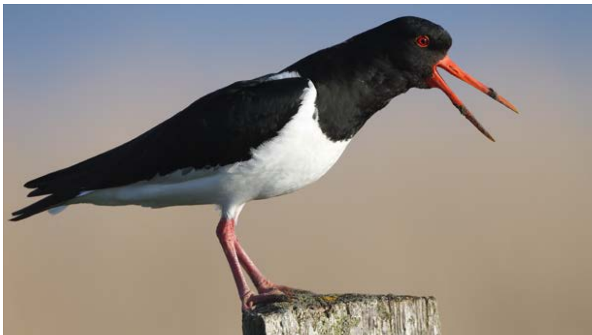
Strandskaden er en af de fugle, som eleverne lærte om og kiggede på i Nivå Bugt Strandenge.

"Når vi står herude og taler om, at en strandskade holder til på lavvandet kyst, bliver vi alle sammen mega begejstrede, når vi samtidig ser en strandskade, der flyver forbi. Så det er sjovt og lærerigt, at det er herude, hvor fuglene rent