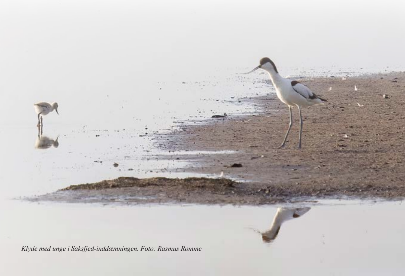
Klyde med unge i Saksfjed-inddæmningen.

De to nye yngleøer gør i den grad mange gode ting for de fugle, der ellers yngler på færre lokaliteter i Danmark og med lavere ynglesucces. Fugletællere i Saksfjed har blandt andet optalt hele 15-18 ynglende par klyder, 80-90 par hættemåger og 8-9 par viber i Fugleværnsfondens del af Saksfjed-inddæmningen. Langt de fleste af disse har ynglet på den ene af de to yngleøer.