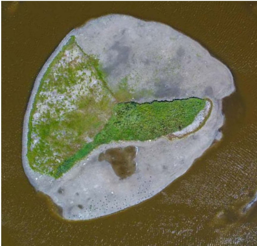
Ynglør i Saksfjed.

Så der skal tålmodighed til. Særligt ternearter og for eksempel klyder, der lægger få æg og lever længe, kan finde på at springe en ynglesæson over, hvis de ikke finder et sted, der er tilstrækkelig egnet som ynglelokalitet. Vi glæder os til at følge antallet af ynglefugle i Saksfjed og se, hvad 2023 bringer.