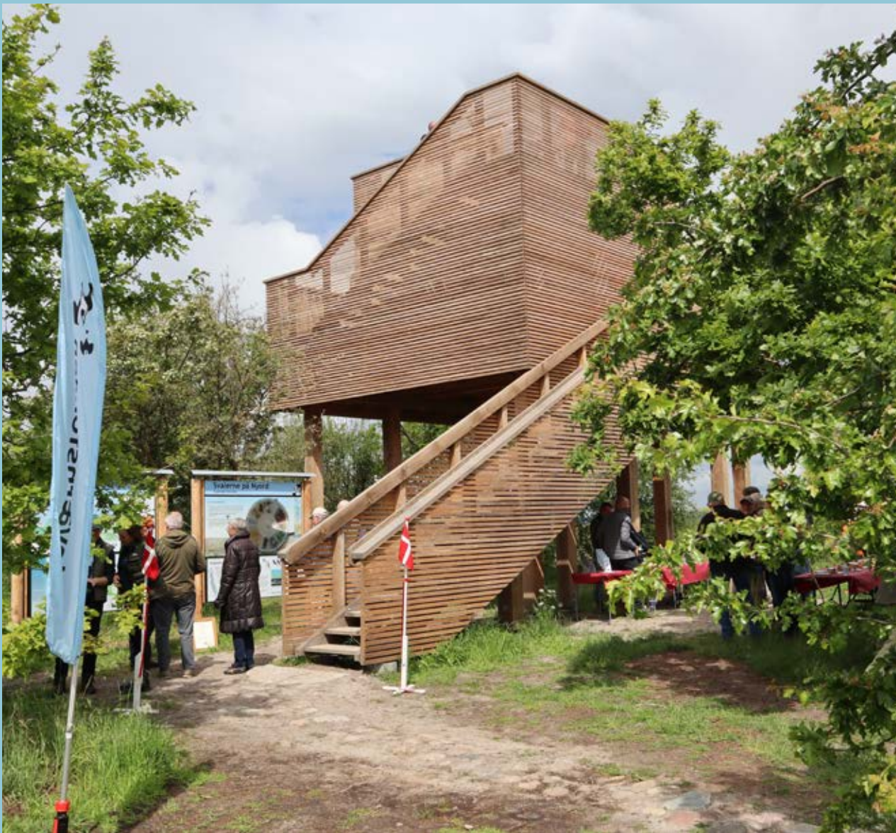
Indvielse af Nyord Naturrum.