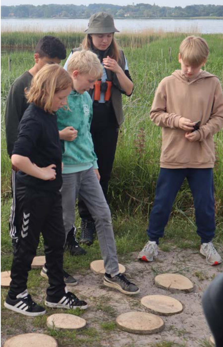
Da 5.-klasserne spillede vendespil, fik de godt gang i snakken og overvejelserne om, hvilke naturtyper de forskellige fugle holder til i.

faktisk er, at vi lærer om dem. Børnene husker det også meget bedre – og forstår vigtigheden af dyrene – når de også har oplevet dem i virkeligheden,” siger hun.