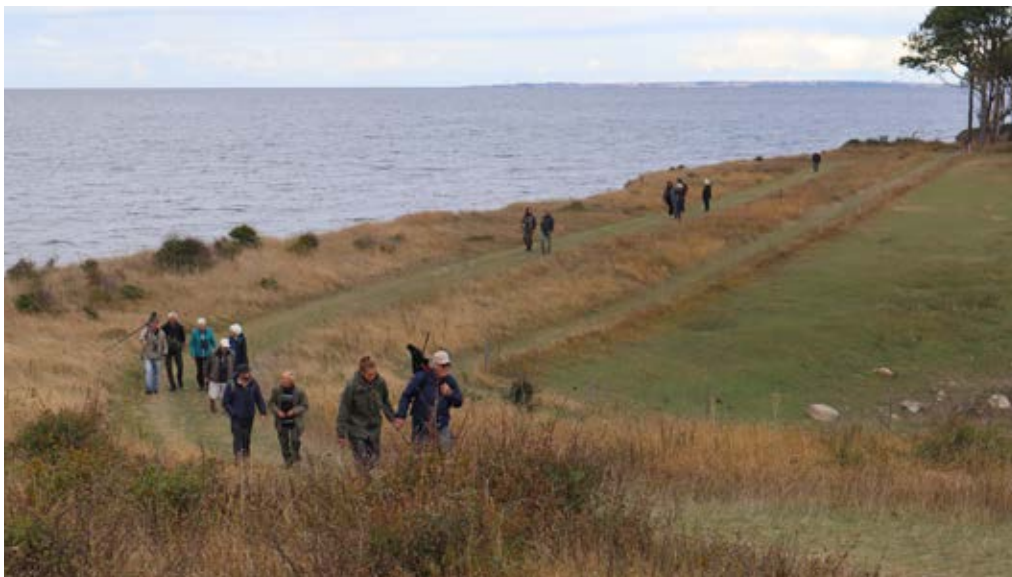
På fællestræffet fik deltagerne en guidet fugletur i blandt andet Gulstav Mose på Sydlangeland.

”Jeg synes, at det er alletiders at være med til fællestræffet. Det er fantastisk både at snakke med nye frivillige og med dem, som har været med i mange år og som jeg kender. Så det burde I også holde en anden gang”, siger han.