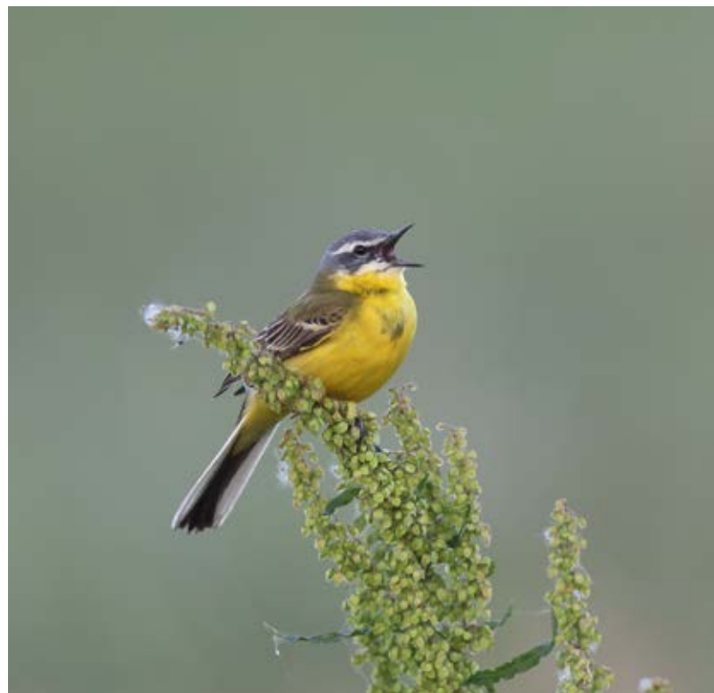
Foto: Gul vipstjert

Tilmeld dig nyhedsbrevet på www.fuglevaernsfonden.dk