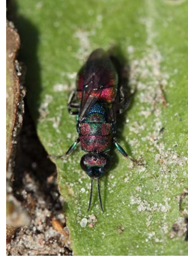
Biulven vogter sin rede. Ubudne gæster kan blandt andet være andre biulve eller biulvguldhvepsen.