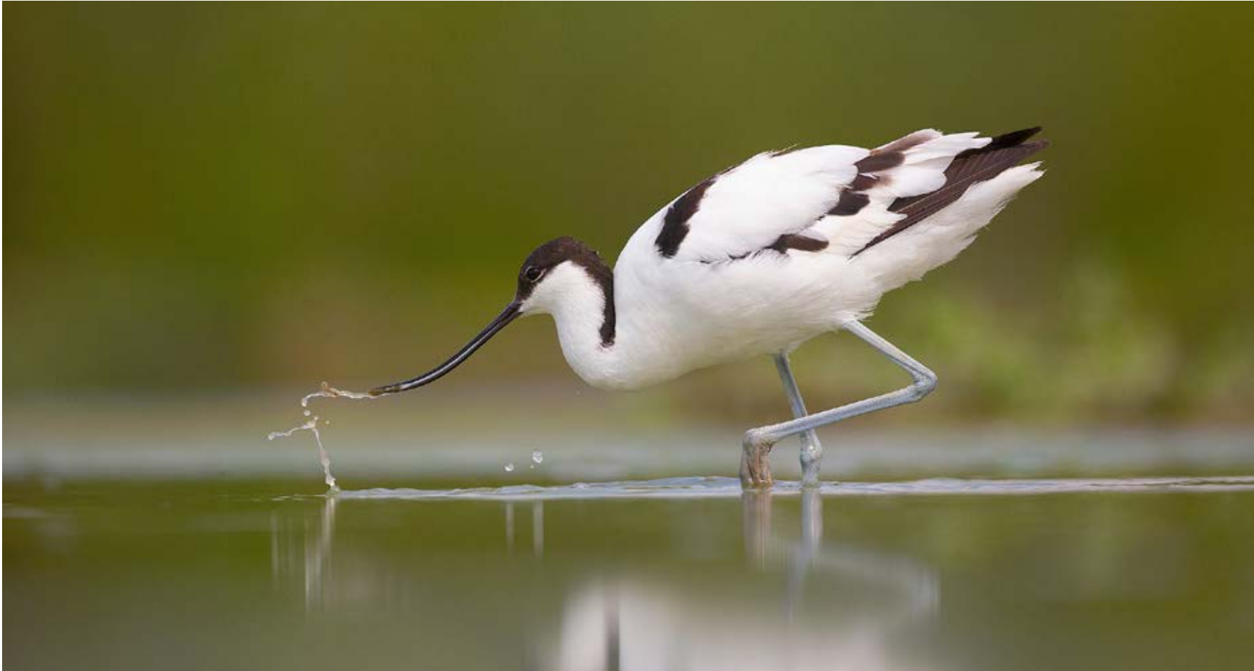
Klyden er en af de fugle, der yngler i Saksfjed-inddæmningen.

15-18 par klyde, 80-90 par hættemåge, 3-8 par splitterne, 19 par fjordterne, 3 par strandskade, 5-6 par stor præstekrave, 4 par rødben og 8-9 par vibe. Dertil blandt andet hele 8 andearter og grågås.